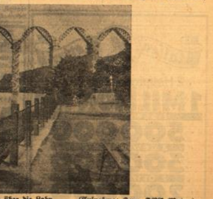
Neue Aufnahme vom Brückenbau über die Bahn. sowie den Taunus durch zwei Rampenbauten hergeführt. In Kürze werden auch diese Arbeiten vollendet sein. Sehr rasch streiten auch die Brückenbauarbeiten im Theisbachdial voran. 507 Meter lang wird diese Brücke werden. Hier ist eine Anzahl der Lehrgestelle bereits ausgemauert. Bisher ist noch in diesem Jahre wird die eine Hälfte der Brücke befahrbar sein.

Schwung der 13 Bögen dieser Brücke. Bis zum nächsten Herbst soll diese Brücke bereits befahrbar sein. Im Laufe dieses Jahres wurden die Arbeiten auf dem Teilabschnitt Wandersmann-Dierdorf fast gefördert. Insgesamt sind 7000 Arbeiter auf dieser Strecke beschäftigt. Ein Teilabschnitt vom Wandersmann-Dierdorf hat bei Wiesbaden bis zum Grauen Stein im hohen Taunus ist jetzt nahezu fertig. Die Erde ist fertiggestellt, und kann jetzt in Arbeit gehen. Die Erde ist fertiggestellt, und kann jetzt in Arbeit gehen. Die Erde ist fertiggestellt, und kann jetzt in Arbeit gehen.