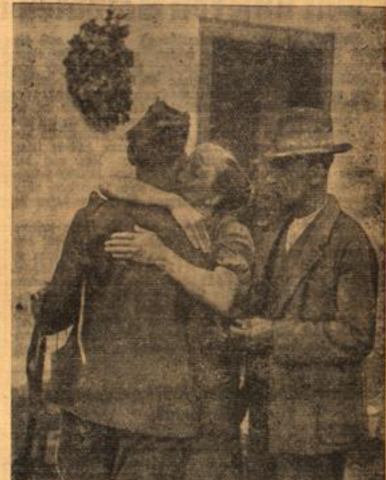
Die Mutter begrüßt ihren Sohn nach wochenlangem Ungewissheit.

Wie überall im befreiten sudeten deutschen Gebiet, so wurden die deutschen Truppen auch bei ihrem Einmarsch in die herrliche alte deutsche Stadt Böhmisches-Krumau mit größter Begeisterung und Freude begrüßt.