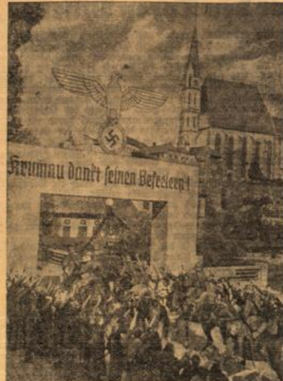
Der Einmarsch der deutschen Truppen in Böhmisches-Krumau.

Nach seiner Fahrt durch die befreiten sudeten deutschen Gebiete wurde der Generalfeldmarschall überall triumphal begrüßt. Unter Bild zeigt Hermann Göring in Freudental, wie er inmitten der jubelnden Menge einem kleinen Mädchen eine Federet geschenkt hat. (Weltbild, R.)