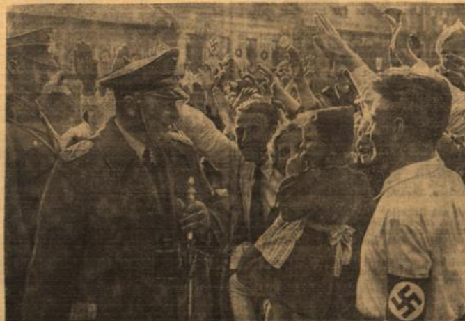
Jahel der Endeten deutschen am Generalfeldmarschall Göring.

Sofia, 10. Okt. Der Chef des bulgarischen Generalstabes, General Bejeff, wurde heute nachmittag um 2 Uhr vor dem Kriegsmuseum erschossen. In Begleitung des Generals befand sich Major Stojanoff, der Leiter des Geographischen Instituts in Sofia. Der Mörder, der mit zwei Maschinenpistolen bewaffnet war, schoß, als Major Stojanoff den General bedecken wollte, auf die beiden Offiziere beide Witten naheinander ab. Im ganzen fielen ungefähr 18 Schüsse. General Bejeff verlor auf dem Wege zum Krankenhaus, während Major Stojanoff schwer verwundet darniederlag und am Abend seinen Verletzungen erlag. Der Mörder richtete dann die Waffe gegen sich selbst und verletzte sich schwer durch einen Kopfschuß. Es soll sich bei ihm um einen ehemaligen Polizisten handeln.