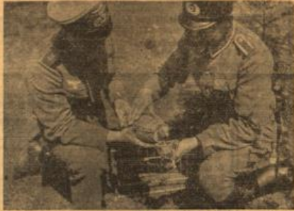
Brieftauben, die durch Viehdiebe befördert werden, liegen in Schutzkästen, um sie beim Transport vor Verletzungen zu schützen.

Die Zweifel an der Verwendungsmöglichkeit der Brieftaube im militärischen Nachrichtendienst, die schon vor dem Kriege aufgetaucht, sind im Weltkriege widerlegt worden; sie gelten heute als überlebt. Im Trommelfeuer,