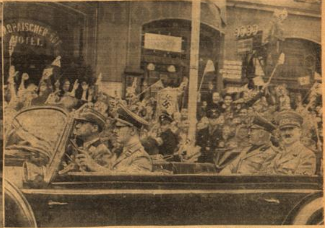
Die Fahrt des Führers und Mussolinis zum Prinz-Karl-Palais. Die Fahrt des Führers und des Duce durch die festlich geschmückten Straßen der Hauptstadt der Bewegung zum Prinz-Karl-Palais, wo der Duce während seines Aufenthaltes in München wohnt, wird mit begeisterten Jubelrufen der Bevölkerung begleitet.