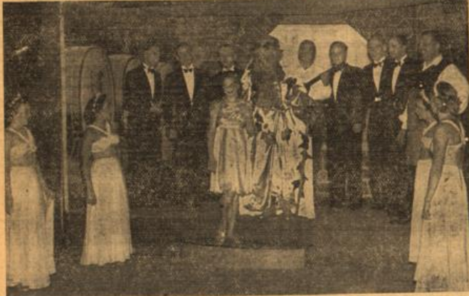
„Uralter Rhein — ewig jung.“