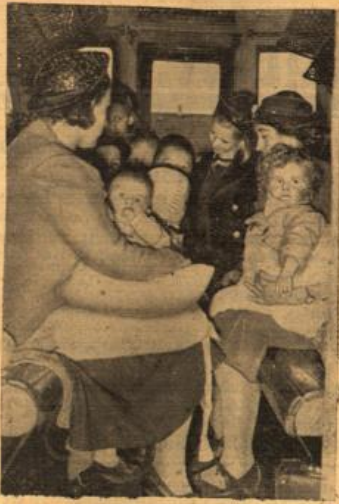
40 000 jüdisch-deutsche Flüchtlinge an einem Tage!