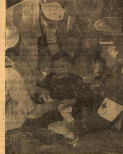
„Erste Hilfe“ beim Verkehrsunfall.

Während am vergangenen Montagabend die Wiesbadener Bereitschaften des Deutschen Roten Kreuzes ihre Einsatzbereitschaft bei einem angenommenen Luftangriff unter Beweis gestellt hatten, zeigten sie am geftigen Sonntag an den Brennpunkten des Verkehrs in mehr als einem Duzend Fällen, ihr ganzes, immer auf dem einsamen ruhendes Können. Erste Hilfe bei Verkehrsunfällen, hier die Aufgäbe, die den fünfzehn verchiedenen Trupps jeweils so gestellt war, wie sie sich zu jeder Stunde ereignen können, wobei eingeschlossen sei, daß im abgelaufenen Jahr 1936/37 durch die Angehörigen der Bereitschaften des Deutschen