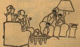
„Ja, die Eltern haben die Kinder von mir aus.“