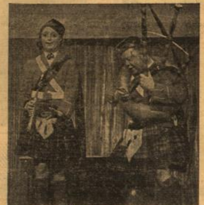
„2 Sittens“, die Exzentrik-Parodisten.