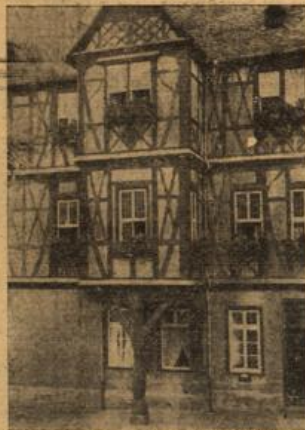
Das Rathaus in Kaffau mit seinem charakteristischen Erker.

Kaffau an der Bahn, am Fuße jener Burg, der dem Ort den Namen gegeben hat, liegt im romantischsten Teil des Palztales. Der stille gemütlige Platz hat sich in den letzten Jahren zu einem viel besuchteren Kurort entwickelt. Darum werden die Anlagen schrittweise bis zur Eisenbahnbrücke erweitert, Tennisplätze und ein geräumiges Strandbad gebaut. Auch ein Kurzentrum wird Kaffau erhalten. Bereits in diesem Jahr wird mit dem Umbau des Rathauses, das ehemals der zu Beginn des