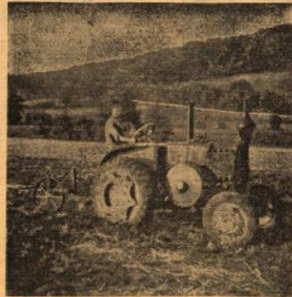
An die Stelle des Pferdes ist vielfach schon der gummi-bereifte Schlepper getreten.

Es ist klar, daß nicht alle in Betrieb befindlichen Geräte den heutigen Anforderungen genügen, weil sie veraltet sind. Und der Bauer wird sich überlegen, wieweit er den Einsatz zweckmäßiger und vor allem leistungsfähiger Geräte mit größerem Ertrag und größeren Einparnissen in Einklang bringen kann.