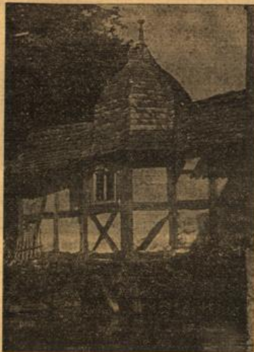
„Das Brückenwunder von Staden.“