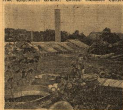
Gemüselplantagen, Treibhäuser — durch das ganze Tal.