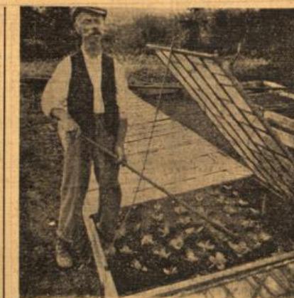
Junger Salat unter Glas bedarf sorgfamer Pflege.