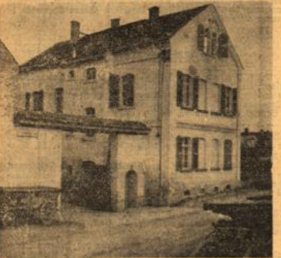
Die Welltrigalmühle — ein altes Wahrzeichen des Tals.