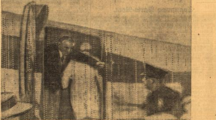
Das erste Flugbild von der Ankunft der deutschen Ozeanflieger.

Es würde hier zu weit gehen, die Mühseligkeiten und Gefahren dieser Züge sowie die häufigen Kämpfe mit den Indianern zu schildern. Im allgemeinen kann man die Expeditionen als Forschungsreisen bezeichnen, denn sie gingen meist darauf aus, endlich die riesigen Reichtümer jener Länder zu entdecken und vor allem auch die Küste der Südsee auf der anderen Seite der großen Insel zu erreichen.