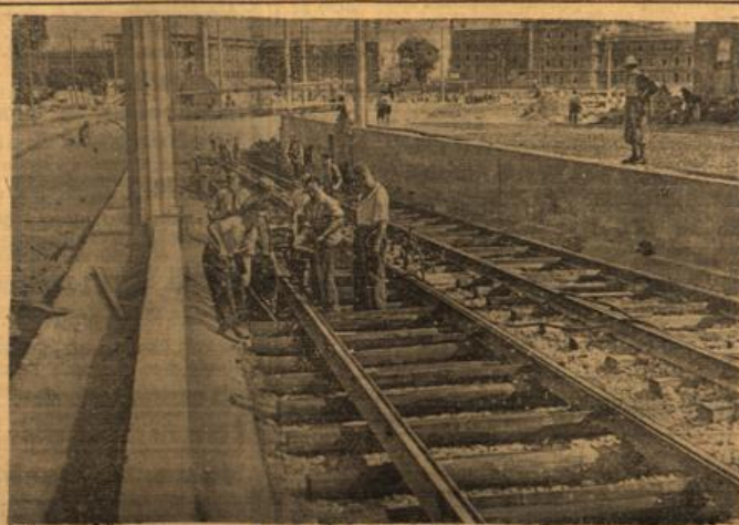
Mit der U-Bahn zum Reichsparteitagsgelände. Im bei den großen Aufmärschen der Partei in Nürnberg. Etodungen im Straßenverkehr zu vermeiden, hat der Führer den Bau einer Untergrundbahn angeordnet, mit der das Parteitagsgelände schnell und bequem zu erreichen ist. Die Fertigstellung des Projektes wird noch in diesem Jahre erfolgen. An der Einbringung in die Kreuzung Allersberg- und Franzenstraße sind bereits die Schienen für die neue U-Bahn gelegt.