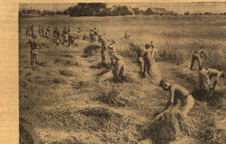
Reichsarbeitsdienst hilft beim Einbringen der österreichischen Ernte. In Dörfern wurden vier motorisierte Ernteschiffe des Reichsarbeitsdienstes eingesetzt, um überall zu helfen, wo ein dringender Notstand zur rechtzeitigen Einbringung der Ernte den Einsatz erforderlich macht. Hier sind ein Teil der Arbeitsmänner das Korn mäht, ist der andere mit dem Binden der Garben beschäftigt. (Reitbild, R.)

Infolge Dürreplagen waren zahlreiche Todesfälle zu verzeichnen. Die öffentlichen Notstandsarbeiten in New