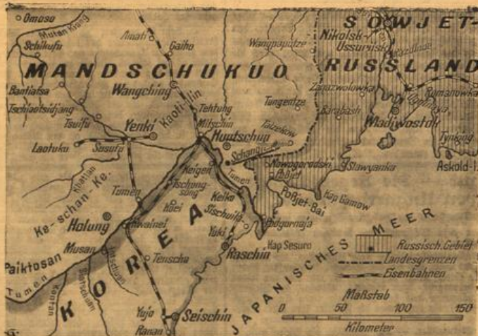
Der Weiterwärtel im Fernen Osten. Karte zu den Kämpfen bei Hunschun-Schangfeng, in der Dreiländercke des Fernen Ostens.

überdarmzelt. Aber viele Stufen steigen wir empor zu dem großen Tempelplatz. Er ist überliefert mit stierlichen Brunnen, die für die heiligen Waisungen bestimmt sind, und mit Gebetsstätten, die die Richtung nach Mecca anbeuten. Und inmitten dieses fast kleinstlichen Wirrwarrs von Tempeln, Halbrundtürmen, Säulen und Portalen mit forstlichen Säulen erhebt sich ein alämisches blauer Dom mit einer der berühmten Kuppeln, die über jenem Flecken erstrahlt wurde, wo Abraham das Opfer Staats vollziehen wollte. Die Mohammedaner behaupten, der Prophet sei in einer hochheiligen Nacht von hier zum lebendigen Himmel emporgehiegen. Das Innere des Tempels ist von unerhörter Schönheit. Korinthische Säulen tragen eine Decke von geschliffenem Jaspis. Die Säulen sind mit goldenen Ornamenten geschmückt. Die Kuppel ist aus dem mächtigen Dunkel. Die Glasfenster, die hier betritt man eine stimmungsvolle Stätte, wo man voller Ehrfurcht auf den weißen Gebetsstätten niedertreten möchte.