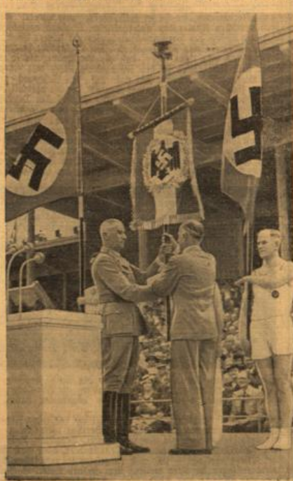
Reichsminister Dr. Frick übergibt dem Reichsportführer v. Tschammer-Dien das neue Bundesbanner des Deutschen Reichsbundes für Leibesübungen zu tragen

Breslau, 29. Juli. In einer bisher noch nicht erreichten Zahl veranlassungen hat am Donnerstagabend im Rahmen des Deutschen Turn- und Sportfestes im Breslauer Konzerthaus die Führerin des Deutschen Reichsbundes für Leibesübungen zu einer Kundgebung. Am Mittelpunkt der Veranstaltung, an der auch Vertreterinnen aus Staat und Bewegung, die Gau-Frauenführerinnen der NS-Frauenfront, die Gau-Frauenführerinnen des BDM, die Führerinnen des BDM-Sports, des Deutschen Roten Kreuzes, des NS-Lehrerbundes, des Reichsarbeitsdienstes für die weibliche Jugend, des Frauenrates der DAF, und anderer mit dem deutschen Sport in Beziehungen stehender Verbände