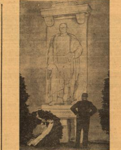
Ein Denkmal für Graf Zeppelin. In der Ehrenhalle des Zeppelin-Museums in Friedrichs ...