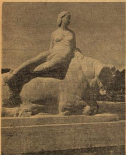
Europa mit dem Stier.

Die „Einheimischen“ machen gern nach des Tages Laft und Mühen einen Abendspaziergang, um auch etwas von den Schönheiten der Kurstadt zu genießen. Die ausgedehnten, vorzüglichsten Grünanlagen in allen Stadtteilen bieten hierfür abwechslungsreiche Möglichkeiten. Nicht nur der Kurpark selbst ist reich und bequem zu erreichen, sondern jedes Stadtbüchel auch abseits des Kurbetriebes hat seine schönen Wege die ins Grüne führen. Die neuen Brunnenanlagen am Bahnhof, mit den weiten Grünflächen und herrlichen Blumenwegen, sind in