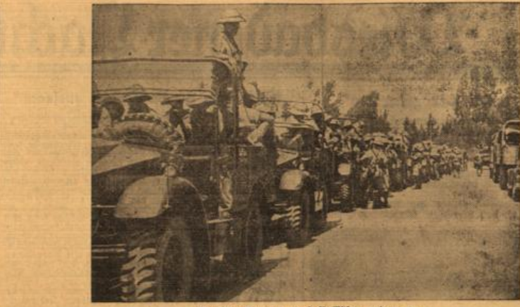
Englische Truppen nach Palästina unterwegs. Wagenkolonne englischer Truppen auf dem Vormarsch in die Unruhegebiete. (Wehrbild-Wagenborg-W.)

Die Schlacht am „Bund“. So eine „offene“ Straße ist z. B. der „Bund“ in Shanghai, der ins gigantische übertriebene „Jungfernhof“ dieser Weltstadt... Hauptgeschäftszentrum. Gemimmel der Menschen, der Autos, Kulis, Klüßchen, der Trams und nur aller denkbarer Verkehrsmittel. Möglich macht ein Schuh... noch einer... Panik! Straße leergeräumt wie bei einem plötzlichen losbrechenden Volksturm. Vor dem Gebäude einer japa-