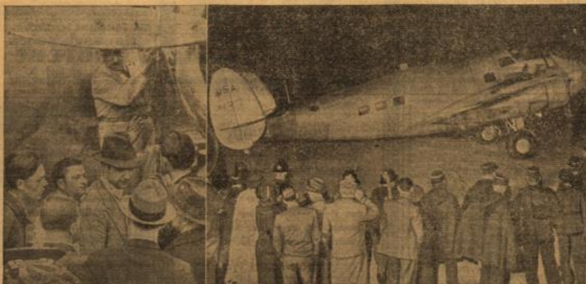
Reforschung um die Erde.

Verloß zum Erdmittelpunkt. Eine wissenschaftliche Expedition ins Erdinnere wird gegenwärtig von einer Gruppe amerikanischer Forscher vorbereitet, deren Ausgangspunkt das Kohlenbergwerk von Red Jacket in USA sein soll, weil hier, obgleich beinahe tiefer Schacht nur 1000 Meter unter der Erdoberfläche liegt, die geologischen Bedingungen für das Untertaken am günstigsten sein sollen. Es wird wieder berichtet, auf welche Weise man die Temperatur, Luftfeuchtigkeit und den ungewöhnlichen Druckverhältnissen Herr werden will, noch mit welchen Mitteln man einen Schacht der Tausende von Metern ins Erdinnere führen soll, zu tunen und sichern gedenkt, und wie man die Menschen, die dort unten arbeiten, ausrüsten wird. Sollte die Expedition jemals über die Vorbedingungen hinauskommen, wird ihre Tätigkeit mit größtem Interesse verfolgt werden.