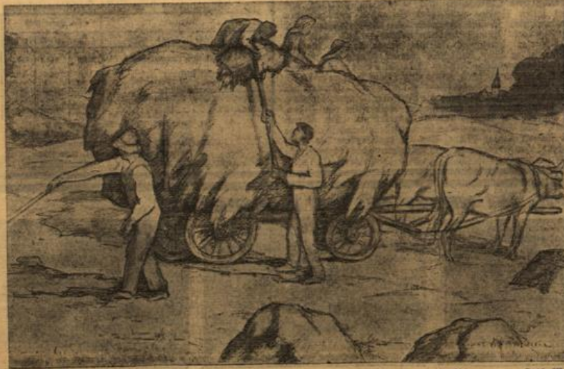
Die Gewerke in diesem Jahr war gut.

Smith konnte mit einem vollbeladenen Dampfer abfahren, den fluchenden und zochernden Sharpe hinter sich lassend. Dietrich G. Ludke.