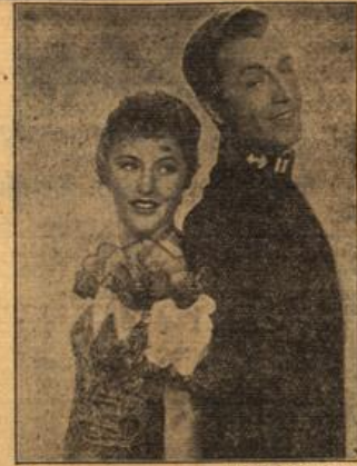
Barbara Stanwyck u. Robert Taylor in dem Film „Unter vier Augen“.

Der neue Roman „Unter vier Augen“ erzählt spannend vom gefährlichen Dienst eines amerikanischen Geheimagenten auf der Spur einer das ganze Land beunruhigenden Verbrechenhand; er gewinnt nach an Intelligenz durch den schicksalhaften Hintergrund. Es ist um die Jahrhundertwende, der Präsident McKinley beauftragt den Leutnant Perry mit der Verfolgung der Bankräuber, die offenbar einflussreiche Verbindungen als Helfer haben, denen kein Fehler übersehen werden kann und an denen die Macht der Finanzwelt zu sehen ist. Nur zwei wissen, um jedem Verrat vorzubeugen, von dem „unter vier Augen“ erzielten Geheimauftrag, und mit vereinbarter Hilfe gehen die Meldungen des Offiziers unmittelbar an den Präsidenten. Dem Geheimagenten selbst es, in den Kreis der Bankräuber eingeweiht zu werden, doch über die Hintermänner, auf die es ihm besonders ankommt, vermag er nichts zu erfahren; so beschließt er, sich gemeinsam mit den Verbrechern auf frischer Tat festnehmen zu lassen, um dann von den Behörden intern vernünftigen Einflusses der Fall die gemündeten Grundlagen herauszuarbeiten. Auch diese Aufgabe führt er durch, aber es erfolgt kein Verstand auf McKinley, und sein Nachfolger, Theodore Roosevelt, weiß nichts von der Geheimabmachung; die gleiche Jutts, für die er kämpft, droht ihm jenseits Leutnant Perry nun unerkannt mit den witzigen Verbrechern zu