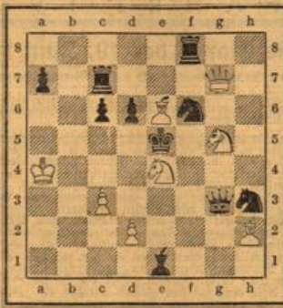
matt in 2 Zügen.

Weiß: Ka4, Dg7, Le6 und h2, Se4 und g5, Bc3, d2. — Schwarz: Ke5, Tc7 und f8, Sg6 und h3, Le1, Ba7, c6, d6. Ein leichter Zweier des berühmten Problemkomponisten, der von Beruf Lehrer ist. Die Aufgabe ist hübsch aufgebaut und enthält reichlich ansprechende Wendungen.