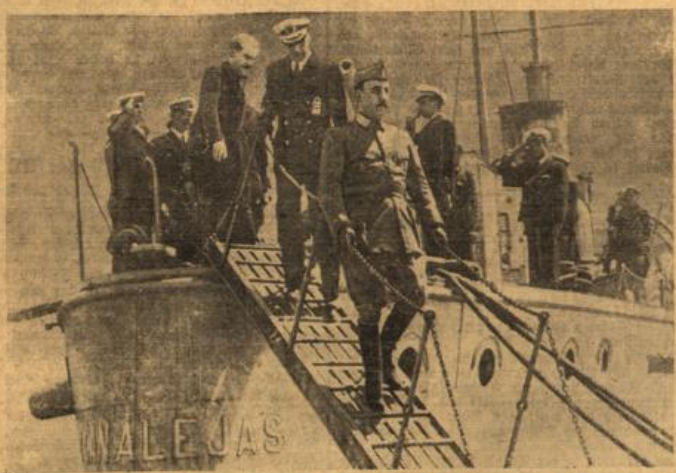
General Franco beschäftigt die nationalspanischen Flotteneinheiten. In dem kirchlich ererbten spanischen Mittelmeerhafen Binatoc nahm General Franco die Parade der nationalspanischen Flotteneinheiten ab. Hier geht General Franco von Bord des Kreuzers „Concelaja“.

Paris, 11. Juni. (Zusammenfassung.) Aus Perpignan kommt wieder eine Meldung über die Niedermetzelung einer Schar von Menschen, die sich dem bolschewistischen Terror in Sowjetspanien entziehen wollten, durch rote Schergen. In dem Grenzort Ojeja fand am Freitag 24 Flüchtlinge eingetroffen und haben sich bei der französischen Mobilgarde gemeldet. Sie bestanden die Abreise einer aus 200 Personen bestehenden Flüchtlingsgruppe dar, die von der spanischen Ostfront nach aus mit zwei Bergführern die französische Grenze erreichen wollte. Nach den Aussagen der Flüchtlinge wurden sie in der vierten Nacht nahe bei Ojeja von einer Abteilung bösser militärischer Grenzwächter überfallen, die sofort heftiges Gewehrfeuer eröffneten. Einige Flüchtlinge, die Revolver bei sich hatten, beantworteten das Feuer. Die anderen verjagten unterdes, sich in der zerstückelten Gebirgsgegend zu retten. 21 Mann wurden aber durch das ununterbrochene Schnellfeuer der Sowjetler getötet. 80 Personen entzogen in die Hände der Roten. Nur 24 gelang es, französisches Gebiet zu erreichen. Sie werden ihrem Wunsch entsprechend wahrscheinlich nach Nationalspanien abgehoben werden.