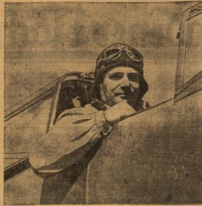
Generalmajor Udet, der mit einem Heinkel-Tagflugzeug mit 634,370 Stundenkilometer einen neuen Geschwindigkeitsrekord aufstellte, nach seinem erfolgreichen Rekordflug.

Der Flugzeugträger des „Intrigantent“ unterreicht ebenfalls die heroertagende Leistung Udet, die man als einen der sensationellsten Erfolge der Fliegerei bezeichnen müsse. Festzustellen sei, daß sich die beachtlichen Anstrengungen Deutschlands auf dem Gebiet der Luftfahrt nicht ausschließlich auf die Erzeugung beschränkten, sondern auch auf die Erhöhung der Geschwindigkeit. Die Leistung des Generalmajors Udet sei deshalb außerordentlich beachtenswert, weil sie beweise, daß die Hindernisse, die sich den Ingenieuren auf dem Gebiet des Apparates und des Motorenbaues entgegenstellten, nachsander überunden wurden und daß der Mensch fähig sei, selbst in einer Haarnadelkurve ein