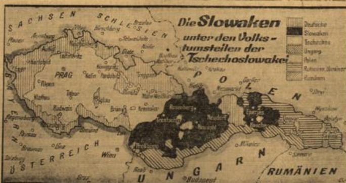
Die Front der Slowaken gegen Prag.

Mexiko-Stadt, 7. Juni. Obwohl nun bereits mehrfach angekündigt wurde, daß die Verfassung General Ceballos unmittelbar bevorstehe, konnten die Regierungstruppen bisher immer noch nicht feiner hochgehrt werden. General Ceballos vertritt jetzt noch wieder über einen kurzweiliger der Nachricht, daß der Aufstand erneut am 1. Juli greife. — Wie verlautet, soll Präsident Cardenas angeordnet haben, Ceballos auf seinen Fall zu lösen. Die Gerüchte über Übergabeverhandlungen des Generals haben sich nicht bestätigt.