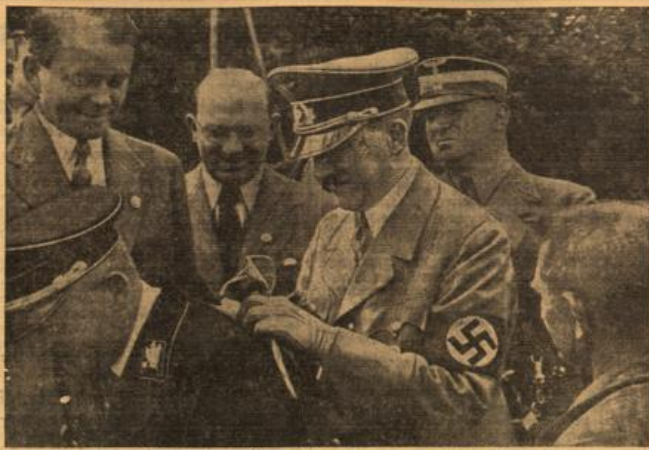
Der Führer gibt auf dem Reichsparteitaggelände einem Arbeiter sein Autogramm. Adolf Hitler weilt in Nürnberg und beschäftigt das Reichsparteitaggelände. — Ein Arbeiter hat den Führer um ein Autogramm. Der Führer gewährte es ihm, und SS-Obergruppenführer Schnauser machte, wie man sieht, das Bild.

Auch Salzburg hat in diesem Jahre sein Gesicht verändert. Für viele war es eine Sensation, künstlich aufgemachte Festspiele gewissermaßen in einem geheiligten Rahmen abrollen zu sehen. Alles, was in Salzburg nur Sensation war, wird hinfort seinen Platz mehr finden, dafür aber wird der Genius loci dieses Ortes, dafür wird Wolfgang Amadeus Mozart eine fröhliche Auferstehung feiern. Die Festspiele in neuer Gestalt leben im Zeichen dieses großen Tonkünstlers, dessen Andenken von Salzburg nicht zu trennen ist. Ein besonderer künstlerischer Genuß wird darin liegen, daß große talentierte Künstler, deren Namen in der Welt unbekannt sind, sich um den Geist und die Gestaltung der Mozartischen Opern diesmal in Salzburg bemühen werden. Als dritter großer Stern dieses Kultursommers leuchten auf die Jubiläumsspiele in Bayreuth. Zu ihren Ehren etwas zu sagen, hieße Eulen nach Athen zu tragen. Die Form und der Ausdruck dieser Festspiele ist in sich so fest und geläufig und künstlerisch begründet, daß sie der Vocalforderung Richard Wagners fast gleichkommen. Es ist das Verdienst der Frau Wagner gewesen, die richtigen Männer zu finden, die von künstlerischen Willen besetzt und begeistert sind, und die das große Werk Richard Wagners so begriffen und erlebt haben, daß sie es in idealer Weise wiedergeben können. Die Sänger und Sängerinnen,