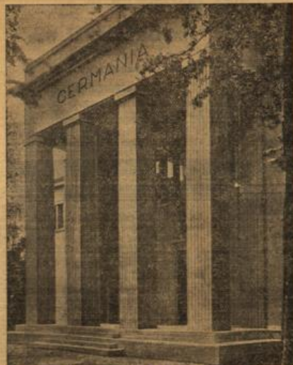
Der neue deutsche Pavillon auf der 21. Internationalen Kunstausstellung in Brüssel (Biennale), der nach den Plänen von Professor Ernst Haiger-Künchen gestaltet wurde.

Um ein Haar wäre gegen Ende des vorigen Jahrhunderts Angola, dessen Verkehr heute noch wenig entwickelt ist, zu einem Verkehrsmittpunkt Westafrikas geworden. Die Portugiesen planten nämlich, ihre Kolonie durch eine Landbrücke mit Kocombang zu verbinden. Hier ließen sie jedoch auf den Wollensbruch Engländer, das keine Interessengebiete gefährdet ist, und wurden schließlich in einem eigenen Vertrag 1894 als versündigt, auf die Errichtung einer dazwischen liegenden Landbrücke zu verzichten.