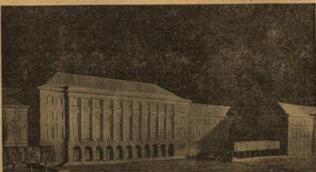
Das Modell des Verwaltungsgebäudes vom Deutschen Gemeindetage.

Auch die Denkmäler der Siegesallee werden ihren Standort wechseln; denn die jetzige Siegesallee wird als Teil der Nord-Süd-Straße erheblich vergrößert. Ein Zurückgehen in die neue Siegesallee darf getrennt sind, noch weniger räumlich zusammenwirken lassen und damit den früheren parfürtigen Charakter der Allee endgültig verlieren. Es ist daher für die Denkmäler ein Parterreweg des Tiergartens gewählt worden, der sowohl von jedem Fahrverkehr frei ist und bleibt als auch auf dem Großen Stern auflieft und diesem damit eine noch größere Bedeutung als Ehrenplatz des Zweiten Reiches verleiht. Die Große-Stern-Allee, der von Südbahnhof zum Rundplatz der Siegesallee führende Weg, soll die neue Siegesallee werden. Hier werden die Denkmäler der Siegesallee weiter in jenseitiger räumlicher Verbindung mit der Siegesallee bleiben. Da sowohl die Siegesallee als auch die Siegessäule zusammen mit den anderen Denkmälern des Königsplatzes historische Baudokumente des Zweiten Reiches darstellen, besteht für uns die Verpflichtung, diese Denkmäler für die Zukunft zu erhalten. Dabei ist es gleichgültig, ob der Wert der Denkmäler im einzelnen heute fast unzutreffend ist. Aus dem gleichen Grunde werden auch die Torbauten der Charlottenburger Brücke, die beim Bau der Ost-West-Achse vorübergehend abgetragen werden müssen, als Bausagen einer historischen Vergangenheit wiedererrichtet.