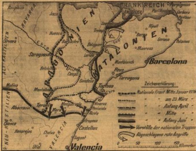
Die Erfolge General Francos.

Das Jahr 1938 brachte den Truppen General Francos große Erfolge: Aragonien wurde bis auf einen kleinen Zipfel südlich von Teruel erobert, die städtischen Gebiete Kataloniens besetzt, durch frühe Vorstöße das Meer erreicht und der Vormarsch auf Valencia und Barcelona unermüdlich vorgetragen. Alle Gegenangriffe der Roten konnten den nationalen Keil zum Meere nicht zurückdrängen.