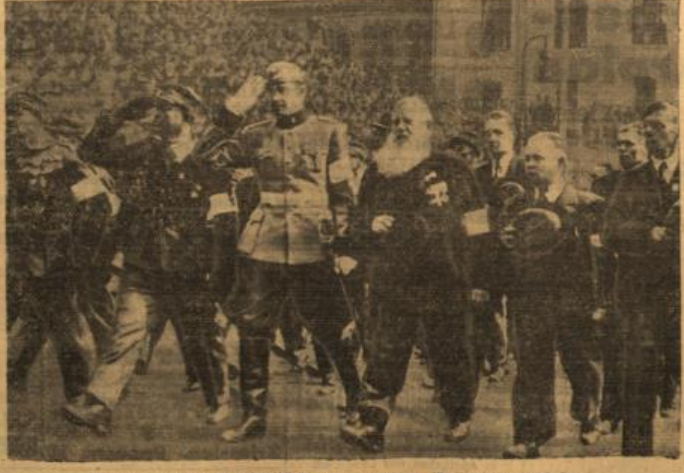
Erinnerungsfest der finnisch-schwedisch-deutschen Waffenkameradschaft.

als auch Valencia Anspruch erhoben haben, verhandelt, ohne daß es zu einer Entscheidung kam. Der Vertreter Spaniens erklärte, wenn die Bank von Frankreich die Herausgabe an Valencia verweigere, so würde dies eine Anerkennung der Franco-Regierung durch Frankreich gleichkommen. Der Vertreter von Burgos vertrat den Standpunkt, daß es sich in dieser Frage überhaupt nicht um den Gegenstand von Valencia und Burgos handle; es handle sich hierüber nur die Bank von Spanien und die Bank von Frankreich gegenüber. Der Vertreter der Bank von Frankreich ertheilte dem Gerichtshof schließlich den Rat, sich vor einer vorläufigen Entscheidung zu hüten. Die Verhandlung wurde auf den 8. Juni vertagt.