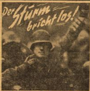
Der gewaltige Kriegstontofilm der Westfront Authentische Aufnahmen aus deutschen und französischen Archiven