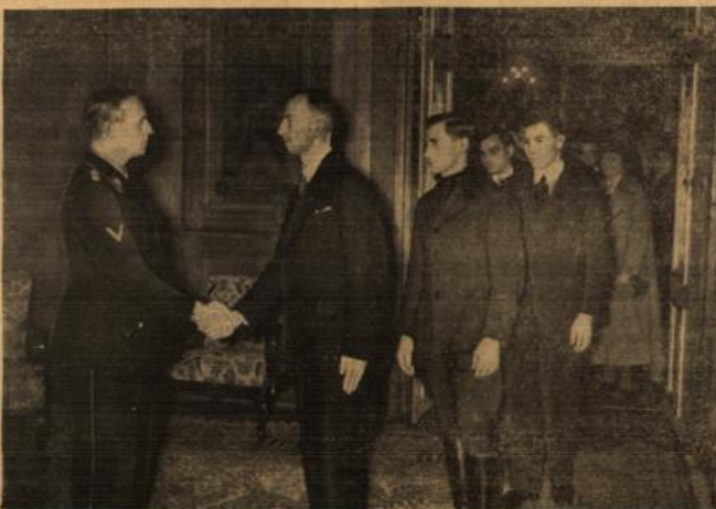
Reichskabinettsmitglieder von Ribbentrop begrüßt seine Mitarbeiter.

Außerdem, so erklärt der Korrespondent abschließend, sei aber im Rahmen der Kolonialfrage eine schwere Beleidigung des gesamten deutschen Volkes wieder gutzumachen, indem man mit der Kolonialschuldfrage aufräume. Indem der Nationalsozialismus die Frage ganz richtig auf den Boden der nationalen Ehre gestellt hat, sind die beiden Demokratien gezwungen, ein schweres Unrecht wieder gutzumachen, wenn sie nicht hincien wollen, daß ihnen auch jedes Mindestmaß an gutem Willen und an Gerechtigkeitssinn fehlt, das zur Aufrechterhaltung korrekter Beziehungen zwischen Kulturvölkern unerlässlich ist. Es handelt sich darum, zwischen einem auf kolonialem Gebiet betriebenen Deutschland, das ohne Sorge in die Zukunft leben kann, und einem Deutschland ohne Rohstoffe und Absatzmärkte zu wählen, dem man täglich das Schaulpiel liberalerier und habgieriger Nationen bietet, die ihm nur die Fälle von ihrem Schemmermal zukommen lassen möchten.