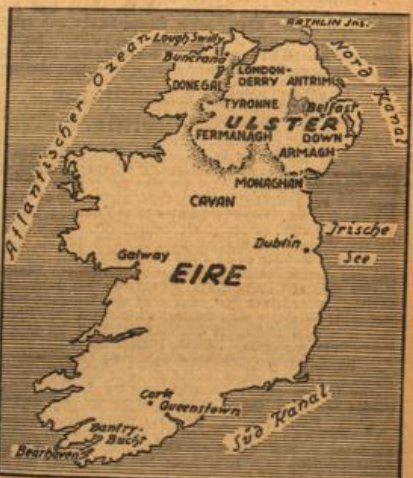
Übersichtskarte von Eire und Nordirland (Ulster)

In Griechenland, so erklärte der Staatssekretär weiter herrsche Ruhe und Ordnung, und die Regierung werde ihr Aufbauwerk ungehindert fortsetzen und durchführen.