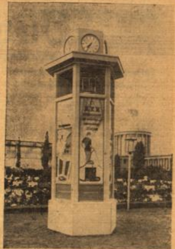
Die neue Reichs-Kaufprecherhäule.

Zwischenhat der König einen Aufruf an das Volk gerichtet, in dem er davon spricht, daß Unruhe und Verzerrung in das Leben und in die Seele des rumänischen Volkes eingebracht seien. Sie verlangten nach einer Entschiedenheit zu tun. Aus diesem Grund habe er eine neue Regierung unter der Präsidentschaft des rumänischen Patriarchen berufen. Eine Regierung von Männern der Verantwortung. Diese Regierung werde das Vermittlungsgebot des Staates entpolitisieren und sich einen Wechsel der Verfassung entsprechend den Notwendigkeiten des Landes vorbehalten. Er, der König, habe sich entschlossen, diesen Weg mit aller Energie und mit der Überzeugung zu gehen, daß er für das Land notwendig sei.