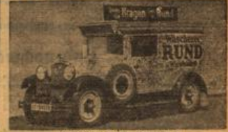
Wäscherei Rund, Riehstr. 8