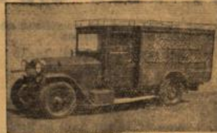
Elvers & Pieper, Friedrichstr. 14