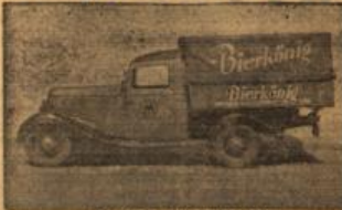
Bierkönig, Loreleiring 11