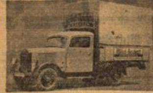
Möbel-Reichert, Frankenstr. 9, Bahnhofstr. 17