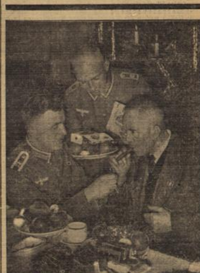
Junge Soldaten beschenken die Allen. Das 3. Bataillon des Inf.-Regiments 67 in Ruben bei Berlin veranstaltete für alle Kameraden, die zu demselben Regiment gehört haben, eine Weihnachtsfeier, bei der die Allen von den Jungen beschenkt wurden.

Dauer- und Kurarten gültig. 21 Uhr: Tanz- und Unterhaltungsprogramm. Kapelle Karl Dastion.