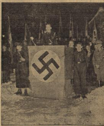
Appell zur Eröffnung des Winterhilfswerkes der nationalsozialistischen Jugend. Die Sammelaktion der HJ für das W.H.W. wurde im ganzen Reich durch Appelle eingeleitet.