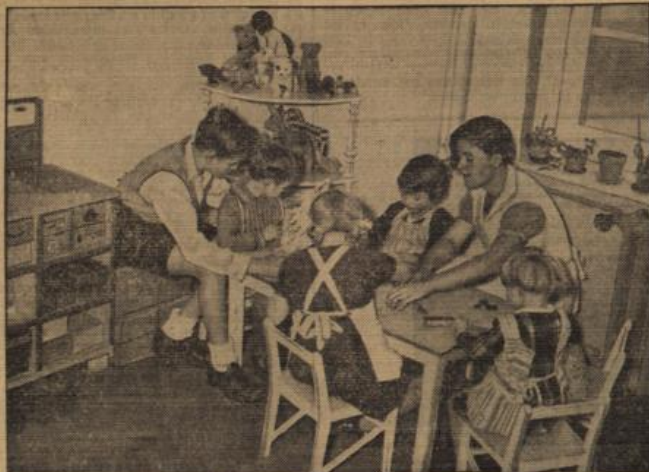
Im Hotel „Zu den drei Tanten“.

Wenn Kinder allein eine mehrere Tage w3hrende Reise antreten, so ist das Problem der 3bernachtung immer recht schwer. In der Reichshauptstadt hat man jetzt auf originelle Weise dem 3belstand abgeholfen, und zwar errichtete man ein Hotel nur f3r Kinder, das den verh3ngnisvollen Namen „Zu den drei Tanten“ f3hrt. Dort sind sie, wie man auf unserem Bilde sieht, unter der erf3hrlichen Aufsicht und gut beh3hrt untergebracht. Nat3rlich ist den Eltern auch m3glich, Kinder dort unterzubringen, wenn sie verreisen wollen oder auch krank werden sollten. In dem Hotel herrscht immer Hochbetrieb.