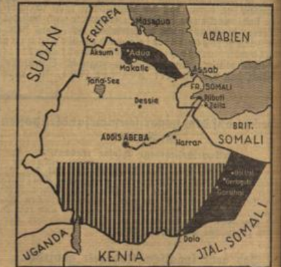
Der Vorschlag zur Aufteilung Abessinien.

jüngste an die Nordfront gebenden Truppen verpflegt werden und wo in den letzten anderthalb Monaten über 150 000 Mann durchgekommen seien, habe es einige Tage ein Lebensmittelknappheit gegeben. Es sei jedoch bereits behoben. Die Moral der abessinischen Truppen sei ausgezeichnet. Die Truppen verlangten ständig um Angest an der Nordfront vorgeführt zu werden. Der Wunsch nach Flugzeugen habe allerdings bei dem ersten Luftangriff einen niederschmetternden Eindruck auf die Bevölkerung gemacht. Die Truppenverbände seien dagegen dem Luftbombardement kaum ausgefetzt gewesen.