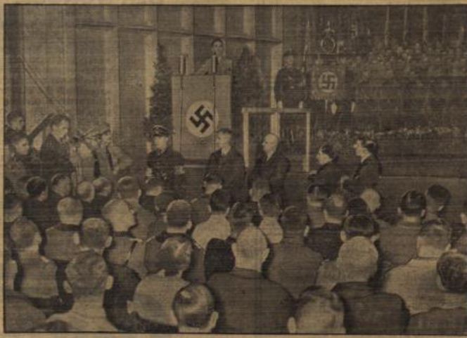
Die Eröffnung des Reichspropagandaamtes in Saarbrücken.

Mit gutem Grund konnte abschließend der Landesbauernführer sagen, daß alle Dienststellen ihre vielseitigen Erfahrungen der Erzeugungsschlacht mitbringen werden; die wechselseitige Zusammenarbeit zwischen den Organisationen und den einzelnen Bauern werde den erwarteten Sieg zum Wohle der Gesamtheit erringen.