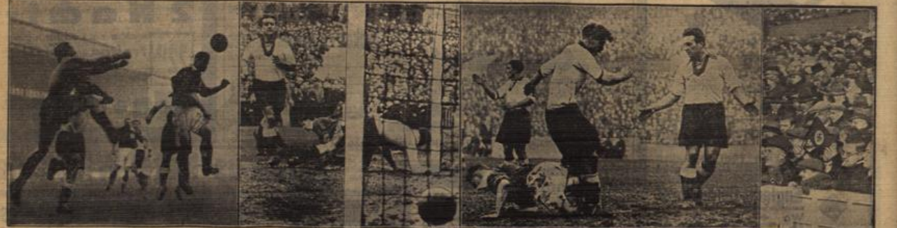
Ein Kurstill von Fußball-Länderkampf des Jahres.

Das Fußballspiel zwischen der Mannschaft des „Columbus“ und einer Mannschaft britischer Seeleute, das am Mittwochnachmittag gleichzeitig mit dem großen Länderkampf in Southampton stattfand, endete mit einem 3:2-Sieg der Engländer. Das erste Tor war von den Deutschen erzielt worden. Auch in diesem Falle herrschte das beste Verhältnis unter den Mannschaften und einer Zuschauermenge von 6000 Personen. Nach dem Treffer waren der Bürgermeister von Southampton und andere führende englische Berufsspieler als Gäste des Kapitäns von Theulen auf dem „Columbus“ zum Tee.