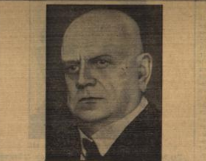
Jan Sibelius.

Geboren ist Sibelius als Sohn eines Arztes in Tavasthus in südwestlichen Finnland. Seine Eltern waren, soweit die Vorgänge feststellen kann, sämtlich Finnen. Standnahrungsmäßige Blutmischung kommt kaum in Frage. Jean hubiert zunächst die Rechte. Doch wie Schumann, Bilow und andere fühlt er sich bald von der kalten Finnischnheit abgehoben. Nach dreijährigem Studium bei Wegelius geht er nach Berlin und Wien. 1893 nach Finnland zurückgekehrt,