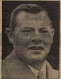
Er „piff“ Deutschland-England.

Siechen kontrollierte der Zuschauer unsere Fahrarten. Er begrüßte uns mit den Worten: „I'm glad to know, it was a very good match!“ Das trifft den Nagel auf den Kopf. Es war wirklich ein großes Spiel. Schlagen konnten wir unsere diesmaligen Gegner nicht, der Leistungsunterschied war zu stark. Aber wir haben diesem Gegner alles abverlangt. Er mußte sein ganzes Können aufbieten, um zu dem klaren Sieg zu kommen, der für uns eine ebenso klare Niederlage ist. Diese Niederlage haben wir in einer Weise hingenommen, an der nichts anzusehen ist. Fußballdeutschland hat die Aufgaben, welche die Englandfahrt an es stellte, nach besten Kräften erfüllt.