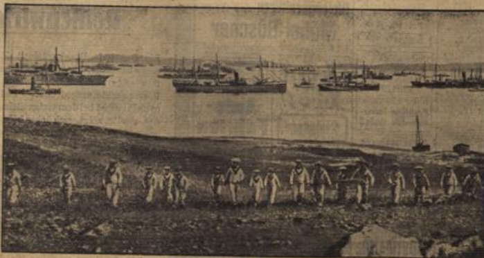
Das Gibraltar der Dardanellen?

Der Glottenberichterstatter des 'Daily Telegraph' bezweifelt die Möglichkeit der Erzielung eines Glottenabkommens, falls die Japaner ihren Plan nicht grundlegend ändern.