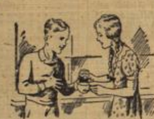
Schnell, Jungs, trink jetzt Wunderbar schmeckt das — jeder sag ich Dir. Den letzten Tropfen frage ich noch, hörst Du?