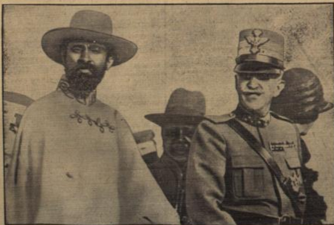
Ein historisches Bildmoment.

Der geregelten Versorgung der Bevölkerung mit Schweinefleisch soll eine Reihe weiterer Maßnahmen des Reichsernährungsministers dienen. Diese zielen u. a. darauf ab, daß der planlose und unkontrollierbare Aufkauf von Vieh außerhalb der amtlich zugelassenen Märkte unterbunden und das im Inlande erzeugte und aus dem Ausland eingeführte Vieh auf die Bedarfsgebiete gerecht verteilt wird. Die jetzt in Angriff genommene Maßnahmen des Reichsernährungsministers bedürfen zu ihrer vollen Auswirkung einer gewissen Anlaufzeit. Sie werden sich aber alsbald zugunsten der gesamten Verbrauchererschaft auswirken.