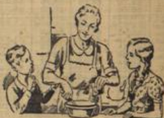
...und geht, Müll, denn in der Dose noch was nachbleibt, so machst Du und noch ganz schnell ein paar Schmeibonbon!