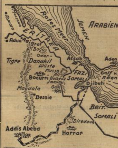
Der Schauplatz der ersten Kampfhandlungen.

Vorweg bemerkt: der Schwerpunkt des Ringens um das Leben oder Sterben des abessinischen Kaiserreiches liegt nicht im jernen Afrika; das letzte Wort wird in Europa gesprochen. In Genf oder London, in Paris oder in Rom. Es fragt sich sehr, ob Mussolini die Unterwerfung des ganzen Landes betreiben wird, oder ob er sich an seinem letzten Vorsatz an den Völkerbund hält, nachdem er nur die eine Hälfte