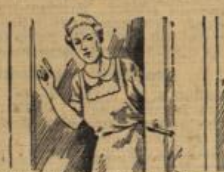
Sünder, löst die Dose sehen! Wenn Ihr noch davon nachst, bleibt ja für die Bomben-bomben übrig. Und für den Kaffee brauche ich auch noch etwas, er schmeckt uns allen doch nur mit Glücksklee.