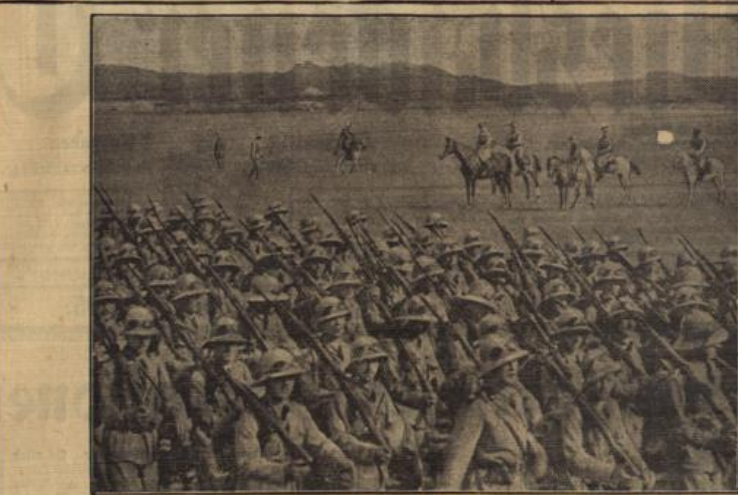
Italienische Truppenparade vor General de Bono in Eritrea.

Zur 10. Mobilisierungsverlautbarung wird an unabhängiger Stelle erklärt, daß das darin erwähnte Vorrücken von Truppen und die Grenzübertritteungen nichts bedeuteten. Die italienischen Truppen seien lediglich in dem sogenannten Reichsmarschland vormarschiert. Auf die Frage, ob namentlich die Feindseligkeiten in Abessinien ausgebrochen seien, wurde erwidert, daß die Feindseligkeiten in Äthiopien praktisch durch die Mobilisierung in Abessinien ihren Anfang genommen hätten. Von kriegerischen Zwischenfällen will man in Rom nichts wissen, von Todesopfern sei auch nichts bekannt. Ebenso wird der Bombardierung über Adua in Abrede gestellt. Im übrigen betont man in unterrichteten