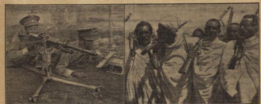
Abessinische Truppen. Links: Maschinengewehrposten des stehenden Heeres. — Rechts: Bewaffnete abessinische Einwohner.

Londen, 4. Okt. (Eig. Drahtmeldung.) Der diplomatische Mitarbeiter des „Daily Telegraph“ schreibt: Da Italien erklärt, kein Vorgehen gegen Abessinien sei nur eine polizeiliche Seemannsmaßnahme, kann es nicht die Rechte eines kriegsführenden Staates beanspruchen. Dieser Punkt ist nicht unumstößlich. Als kriegsführende Macht könnte Italien das Recht beanspruchen, Schiffe in roten Meer anzuhalten und nach Kriegsmaterial zu durchsuchen. Bei der jetzigen Sachlage würde dieses Recht nicht anerkannt werden. Es verlautet, daß Italien bereits beschloßen hat, keinen Versuch zu machen, die neutrale Schifffahrt zu hören.