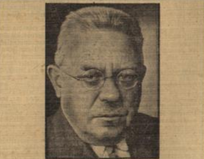
(Graph. Werffstätten, M.)

Halbe, aus der etwas schwermütigen Landschaft der westpreussischen Weichseliederung stammend, ist in seinem Empfinden immer heimatsgebunden gewesen. Man darf ihn nicht nur um seines Falles, wenig erfolgreich gewesenen Schauspielers willen, wegen, in dem er in einer Gestaltung der Vorgänge vom Jahre 1812 den Kampf zwischen Weltbürgertum und nationaler Idee darstellte, einen echten Deutschen nennen, sondern vor allem auch deshalb, weil er in beiführenderem Grenzraum dem Blute und dem Boden des Volkes immer tief innerlich verbunden blieb. In diesen seiner Dramen und Geschichten, auch da, wo er die Probleme des überprüften Intellektualismus seiner Zeit abhandelt, steht die wehrpreussische Heimat, steht der mächtige Strom der Weichsel mit seinen treibenden Eisschollen und den breit sich dahinwälzenden Fluten als Stimmungsinstrument hinter der gedanklichen Auseinandersetzung. Und die Menschen, die er zeichnete, kamen aus diesem Niederungslande, schwerfällig, erdbebunden und doch, wenn die Fessel der Kon-