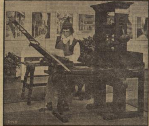
Die „Schwarze Kunst“. Ein Jünger Gutenbergs an einer alten Buchdruckerprelle.