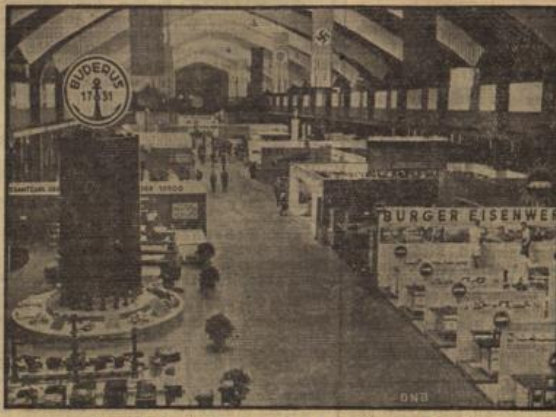
Ein Bild in das „Haus der Technik“, das sämtliche Wirtschaftszweige der Technik unjeres Gebietes beherbergt.

Das Ausstellungsgelände täglich bis 20 Uhr geöffnet. Auf dem Festhallengelände ist auch ein Ausstellungsbereich eingerichtet worden, das wertvolle Kultur- und Werkschau vorführt und damit eine wirkungsvolle Ergänzung der hervorragenden Zeilungsschau darstellt. Man kann hier durch erstklassige Filmvorführungen einen Einblick in die wichtigsten Betriebe unseres Wirtschaftsgebietes gewinnen. Die Vorführungen sollen in Zukunft auch noch eine Stunde lang nach Ausstellungsschluß durchgeführt werden (also bis 21 Uhr).