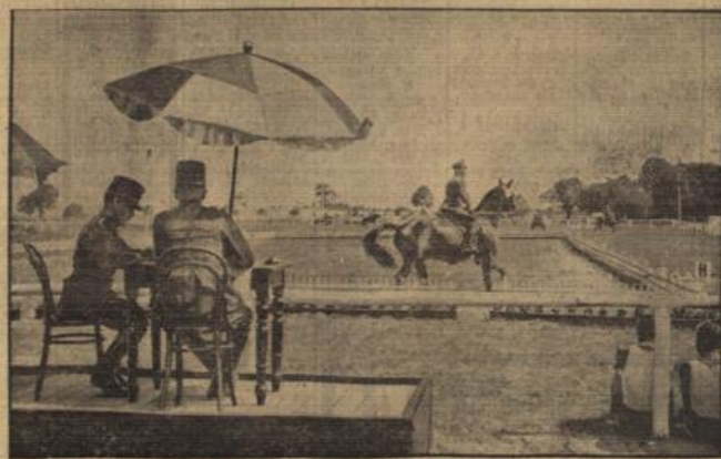
32 Nationen reiten in Döberitz.

1. Kurmi (Hptm. Stubbendorff) 90 Punkte; 2. Fajan (Rittm. von Blöde) 85 P.; 3. Eptor (E. Kahl-Holland) 83 P.; 4. Hädel wie zu (Obst. Cabut de Kortanges-Holland) 83 P.; 5. Lupp (Obst. von Bastong-Ingarn) 82 P.; 6. Panas (Obst. Groß-Ingarn) 80 P.; 7. Stolle Lt. de la Rousselle-Frankreich); 8. Grant (Rittm. Lippert).