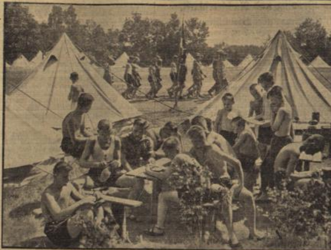
Hier trifft sich die HJ. der ganzen Erde. Im Deutschlandlager bei Ruhmühle in der Mark Brandenburg, dessen 400 Zelte Hiltlerjugend aus aller Welt zum Welt-Jugendtreffen annehmen werden, sind bereits die ersten Vorformandos eingetroffen.