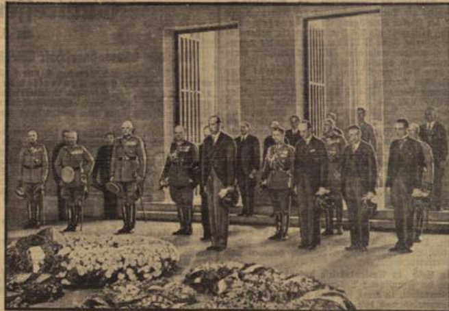
Polens Außenminister im deutschen Ehrenmal. Der polnische Außenminister Oberst Bed legte zur Ehrung der gefallenen deutschen Helden im Ehrenmal Unter den Linden einen Kranz nieder.

Wochen, 4. Juli. Zur Veranlassung der K.S. Frauenenschaft fand am Mittwochabend ein Filmvortrag über das Auslandsdeutschtum statt.