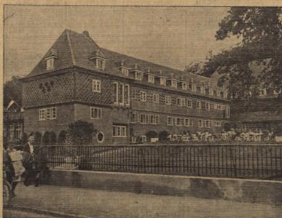
Olympia-Heim der Segler in Kiel.

Die deutschen Fahrer haben am ersten Tag keineswegs schlecht, aber auch nicht überragend abgeschnitten. Überausch schlugen sich die Erziehten besser als die „Alle“. Der Wiesbadener Jdes wurde Erster vor