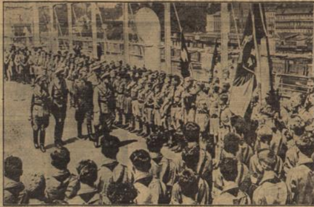
Hitler-Jugend aus Südamerika besucht Deutschland.

150 Jungen und 120 Mädchen aus Argentinien, Chile, Paraguay und Uruguay sind hier mit dem Dampfer 'Cap Arcona' in Hamburg eingetroffen, um als Gäste der Reichsjugendführung einige Monate in Deutschland zu weilen.