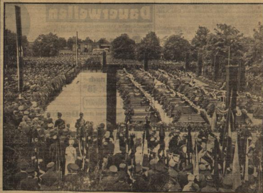
Die große Trauerfeier unter freiem Himmel.

Ein heftiger Regen war niedergegangen, als die mit Trauerflor, Blumen und Tannenzweigen geschmückten Wagen mit den Särgen die Fahrt in die Heimat antraten. Die Männer der SA und der Sanitätsmannschaften des roten Kreuzes hielten auch hier noch neben ihren toten Kameraden Wache. Demnach wurden die Särge in Gruppen aufgeführt, keine Stimme laut wurde, ging es jetzt nach alter Soldatentradition mit Marschschritten und mit einem alten Kampflied auf den Gipfen heimwärts. Die Gefolgshatten suchten ihre Betriebe auf. Bald zog wieder Leben in Wittenberg ein. Jedoch blieben hier bis auf die Lebensmittellieferanten alle anderen Gebäude geschlossen. Das Bunt der Uniformen, unter denen besonders die vielen Halloren in ihrer bekannten Tracht aufhieten, belebte unter den flackernden Fahnen des Dritten Reiches aber schon wieder die Straßen. Auch am Mittwoch finden noch Beisetzungen statt, und während sich über den Gräbern der Toten die Hügel wölben, stehen draußen in den Werten die Lebenden an ihren Arbeitsplätzen, um weiter zu schaffen im Dienste der Nation, die in so wunderbarer Weise in tief empfundener Volksgemeinschaft Anteil genommen hat an dem Schicksal der Hinterbliebenen der Opfer von Reinsdorf.