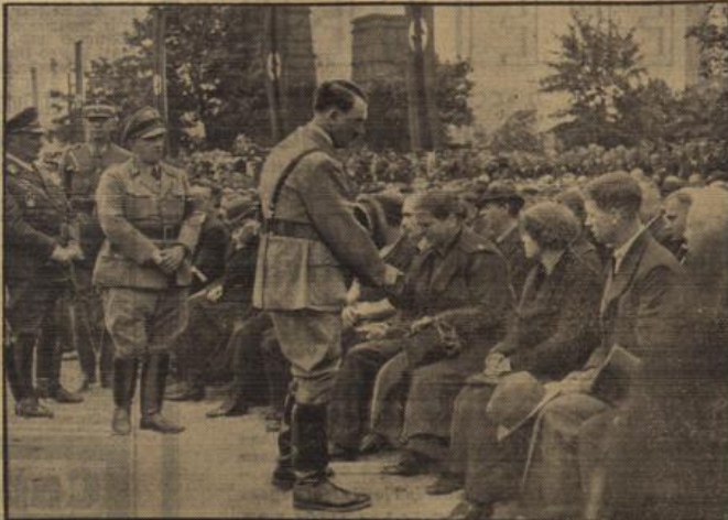
Der Führer bei den Hinterbliebenen.

er weiter aus: Wie alle Volksgenossen, so trauern in erster Linie der Führer und Kamerad und die Männer der Partei und des Staates über ein Unglück von so gewaltigem Ausmaß. Es könnte uns erschüttern und schwach machen, lebten wir nicht in einem Volle und einem Reiche, das wieder auferstanden ist zur Freiheit und zur Ehre, und wo jeder einzelne Volksgenosse den letzten Einfluß haben wird, wenn es der höchsten Güter der Nation gilt. So sind auch diese toten Arbeitskameraden gefallen für das neue Reich, gefallen für die Auferstehung ihres Volkes. Und so gemalig und so erfüllend der Tod hier eingetreten hat, so erfüllt auch aus diesen Opfern, aus dem Tode dieser tapferen Arbeitskameraden ein großer Segen für das ganze Volk und für die ganze Nation. Denn in der Art und Weise, wie