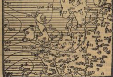
Ein sich rasch über England entwickeltes Tief brachte am Dienstag ganz Westdeutschland sehr ergiebige und langandauernde Niederschläge, die gegen Abend wieder in Gewitter übergingen. Ein von Westen nachfolgendes Steiggebiet des Luftdruckes wird uns am Mittwoch voraussichtlich wieder mehr freundliches Wetter bringen, doch kommt es bei wieder höheren Temperaturen noch zu gewitterhaften Niederschlagsphasen.

Witterungsaussichten bis Donnerstagsabend: Nach vorübergehender Aufheiterung wieder Bewölkungszunahme, keine wesentlichen Niederschläge, weiterhin ziemlich kühl, mäßige westliche Winde.