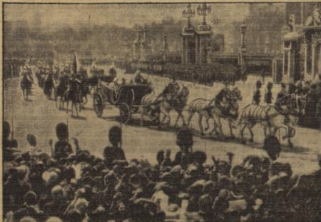
Ein Junfbild von den Londoner Jubiläumsfeiern.

Die Botschaft, die der König von England am Montagabend an die Einzelstaaten des Britischen Imperiums richtete, wurde mit einer Rede des englischen Ministerpräsidenten eingeleitet, in der Macdonald u. a. folgendes sagte: „Uns allen Teilen des Erdballs, aus den Dominien, aus Indien, den Kolonien und Schutzgebieten haben wir an diesem glücklichen Tage Grüße und Ausdrücke der Sympathie und Achtung gegenüber Seiner Majestät geschickt. Jetzt am