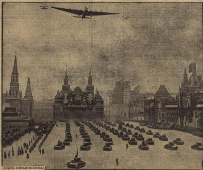
Der 1. Mai in Moskau. Hand im Zeichen einer gewaltigen Truppenparade. Auf dem Roten Platz vor dem Kreml marschierten Tausendregiment auf, während in den Lüften das Riesflugzeug „Maxim Gorki“ — begleitet von kleinen Kampfeinfliegern — seine Kreise zog.