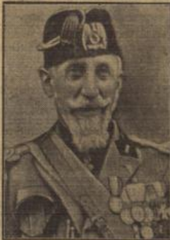
Der italienische General de Bono.

as. Berlin, 12. Febr. (Drahtbericht unserer Berliner Abteilung.) Die italienische Regierung hat zwei Divisionen mobil gemacht. Es handelt sich um die Divisionen, deren Garnisonen in den Militärbezirken Florenz und Messina liegen. Um diese beiden Divisionen auf Kriegsstärke zu bringen, sind Reservisten des Jahrganges 1911 einberufen worden, jedoch ist nicht etwa die Einberufung des gesamten Jahrganges erfolgt. Es sollen aber auch