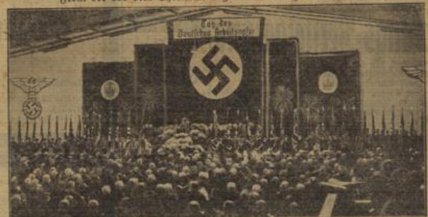
Am Ehrentag der deutschen Arbeitssopfer

Die die sterbliche Hülle des Dichtersüßlen birgt, saute sich der Strom der Besucher, die dem großen Toten huldigen. Unter den Besuchern waren die Großherzogin Feodora von Sachsen-Weimar-Eisenach und (neben ihr) Erbgroßherzog Karl August von Sachsen-Weimar-Eisenach (in Reichswehruniform).