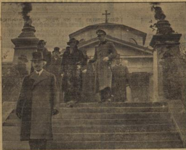
Vor der Weimarer Fürstengruft.

Die anlässlich des 20. Jahrestages des heldenmütigen Sturmes junger Regimenter auf Langemard veranstaltet wurde: Generalfeldmarschall von Mackensen schreitet die Front der vor dem Ehrenmal angetretenen Langemardkämpfer ab.