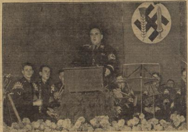
Reichsbauerntag in Goslar.