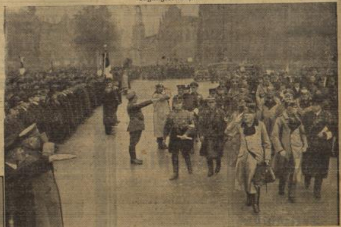
Von der Langemard-Feier in Berlin.

Der Reichsleiter der Deutschen Bauernschaft, Reichsminister Walther Darré, begrüßt bei der Eröffnungsfester zum zweiten Reichsbauernntag in Goslar die Tagungsteilnehmer.