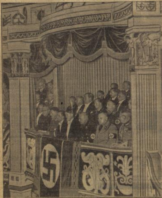
Der Führer bei der Schiller-Gedenkfeier.