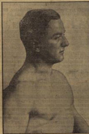
Olympiasieger Ismayr-München, der in Genua die Europameisterschaft im Gewichtheben der Mittelgewichtsklasse gewann.

Der Wiesbadener Sport hat bei geschlossenem Auftreten schon mehrfach Beweise seines Könnens und seiner Kraft geliefert, aber noch nie haben die Wiesbadener Vereinsleiter so einmütig nebeneinander gestanden und waren sie mit ihrem Vertrauensmann darüber einig, um wieviel höher die Anforderungen zu veranschlagen sind, die über enger gestellte Reizbarkeit hinaus zu dem großen Ziel der großen deutschen Gemeinschaft führen. Das war an und für sich schon ein erfreuliches Ergebnis. Die Verbindung zwischen der Wiesbadener Turn- und Sportbewegung mit den örtlichen Behörden und Parteigliederungen in dessen Händen liegt, dürfte auch die gelohene Arbeit aller Beteiligten reiche Früchte tragen.