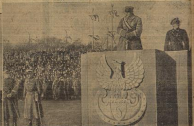
Polen feierte den Unabhängigkeitstag.

Der jetzt von Wilhelmshaven aus zu einer achtmonatigen Auslandsreise in See ging.