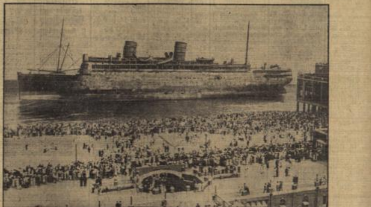
Die „Morro Castle“ an der Küste von New York.

14 Chinesen in Mandchukuo hingerichtet. In Heihe wurden wegen Hochverrats und Teilnahme an den Kämpfen gegen mandchurische und japanische Truppen 14 Chinesen hingerichtet. Vier dieser Chinesen hatten an dem Anschlag auf die chinesische Kubaun teilgenommen und galten als Führer der Aufstandsbewegung in Mandchukuo.