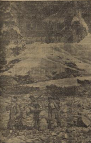
Von der Bergsteigertruppe in Wettersteingebirge.

Druck- und Verlagsanstalt: Wiesbadener Tagblatt. 6. Schillingstraße bei der Hauptpost, Wiesbaden, Langgasse 21, „Tagblatt-Box“.