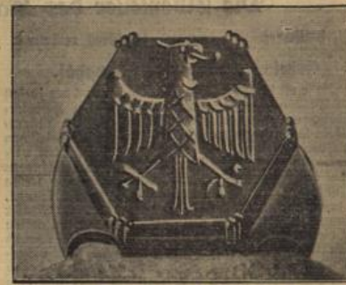
Der „Deutsche Ring“ des Führers.

Der Auslandsbesuch war — wie nicht anders zu erwarten ist — gering. Trotzdem kann festgestellt werden, daß in der Möbelmesse Abschlüsse mit Frankreich, Holland, Dänemark und der Schweiz getätigt werden konnten. Zusammenfassend kann gesagt werden, daß die Messe einen überaus guten Anfang nahm. Nachdem die Aussteller bereits am ersten Tage ihre Katalogbücher füllen konnten, sieht man den weiteren Messetagen mit großer Zuversicht entgegen.