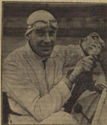
Hans Stud — Deutscher Bergmeister. Durch seinen Sieg im Großen Bergpreis von Deutschland, der auf der Schauins-Land-Strecke bei Freiburg zum Austrag kam, hat sich Hans Stud den Titel des Deutschen Bergmeisters 1934 geholt.