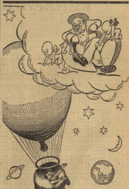
St. Petrus: „Hat man denn nicht mal hier oben seine Ruhe mehr!“

Chinesischer Dampfer mit 45 Mann gesunken. Ein chinesischer Dampfer, der sich auf der Reise von Tschifu nach dem südlichen Sachalin befand, ist bei Sachalin in einen Taifun geraten und mit 45 Mann Besatzung untergegangen.