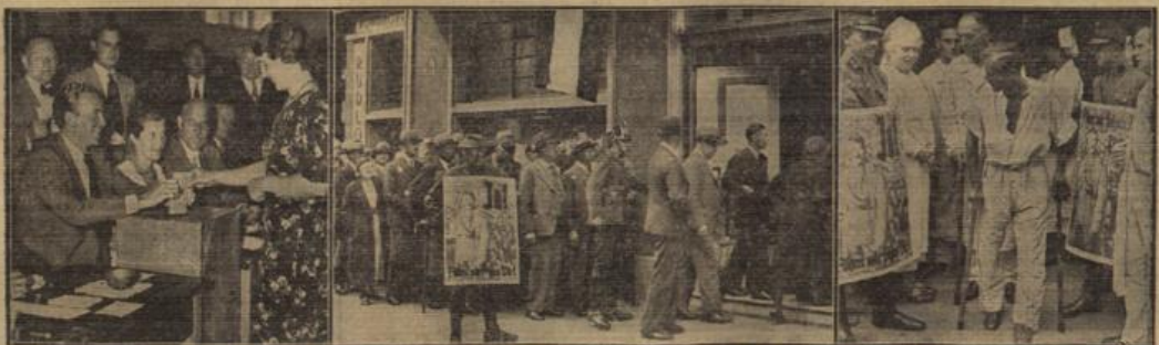
Der Filmhauptspieler Willy Fritsch zeigt sich als pflichtbewusster Staatsbürger und gibt eine Gastrolle als Wahlvorstand eines Abstimmungstotals in Berlin-Dahlem — wie hier, so standen überall vor den Wahltotalen die Wähler „Schlange“, um dem Führer ihr „Ja“ zu geben — auch in den Krankenhäusern wurde gewährt, und wer konnte, schritt selbst zur Wahlurne.

Jahrelange nordbergehend im Saargebiet weisende Reichsdeutsche Irrenten heute zu den nahegelegenen Grenzorten, um dort ihrer Wahlpflicht zu genügen.