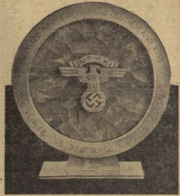
Deutschlands großer Bergpreis aus Bernstein.

Die Seitenwagenkämpfe erbrachten in der kleinsten Klasse den Sieg des Imperia-Fahrers Loos, der damit an diesem Tag zum 3. Male erfolgreich war. In der 600ccm-Seitenwagenklasse siegte Kahrmann-Gulda auf Hercules, in der 1000ccm-Klasse Toni Sabl-Wiesbach auf