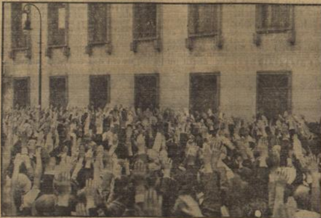
Kundgebungen für den Führer.

Paris, 20. Aug. (Eigene Drahtmeldung.) Die Schluß- folgerungen, die die französische Presse aus dem Ergebnis des Volkstumschreibens vom Sonntag zieht, waren mit fast mathematischer Sicherheit vorauszusagen. Obwohl die Blätter in ihren Berichten die ungeheure Begeisterung schildern, mit der das deutsche Volk an die Wahlurnen ge- treten ist, wollen sie weniger die gewaltige Stimmzahl der Ja-Sager betonen, sondern klammern sich an die Stimmen der Nein-Sager, um daraus triumph- haft wenn nicht einen politischen, so doch einen „psycho- logischen Mißerfolg“ (!!) zu konstruieren. Doch schreibt der „Ami du Peuple“: man muß sich vor der Tatsache heugen, Hitler bedeutet das Deutschland von 1934. Er kann in seinem Namen das Volk des Volkes sprechen, nicht nur als ein Vertreter oder Stabschef, sondern auch als die