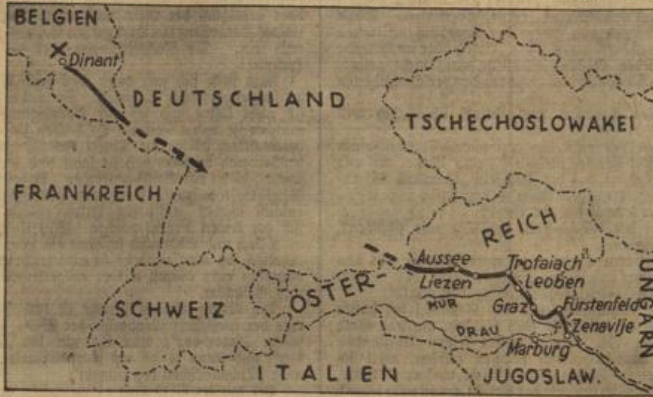
Der Weg des Stratosphärenfluges.