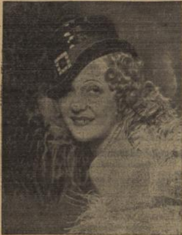
Marta Eggerth als Sylvia Varescu in dem Ufa-Tonfilm „Die Cardasfürstin“

Der Ufa-Palast eröffnete die neue Spielzeit mit der berühmten „Cardasfürstin“, Emmerich Kálmáns berühmter Operette, die sich vor zwei Jahrzehnten die Bühnen im Sturm eroberte und als Tonfilm nichts von ihrer Frische und Ursprünglichkeit, ihrem Humor und der lebensfrohen Tanz- und Gesangsrendite verloren hat.