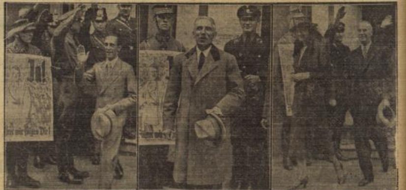
Unsere Bilder vor dem Minister-Wahlstotal in Berlin zeigen, daß auch die nächsten Mitarbeiter des Führers ihre Wahlpflicht erfüllen (von links): Reichsminister Dr. Goebbels nach dem Wahlgang — Reichsminister a. D. v. Papen, der jetzt als Gesandter in Wien wirkt, ist zur Wahl nach der Reichshauptstadt gekommen, und genügt hier seiner Wahlpflicht — auch Reichsminister Dr. Fricz machte den Weg zum Wahlstotal und gab seine Stimme dem Führer.

Die Linden, vor allem aber die Wilhelmstraße und Wilhelmplatz, waren seitweil schwarz von Menschen. Die Tausende von auswärtigen Besuchern der Ausstellung, die hier in größeren Trupps spazierten, denkten ihre freie Zeit, um den historischen Stätten deutscher Geschichte einen Besuch abzustatten und um eine der führenden Persönlichkeiten oder gar den Führer selbst einmal sehen zu können.