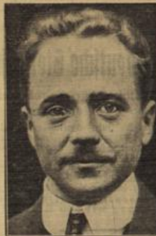
Bundeskanzler Dr. Dollfuß.