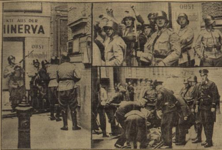
Erste Originalbilder von den Unruhen in Wien.

Links: Das Gebäude der Wiener Kanak wird von der Exekutive gestürmt. — Rechts oben: Die Terroristen werden nach schwerem Feuerkampf abgeführt. — Rechts unten: Ein bei den Kämpfen verletzter Polizist wird abtransportiert.