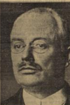
Dr. Anton Rintelen.