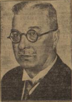
Der Vorsitzende des Volksgerichts.

Berlin, 13. Juli. Amlich wird mitgeteilt: Der Reichsanwalt hat auf Vorschlag des Reichsministers der Justiz gemäß Artikel III § 2 des Gesetzes zur Änderung von Vorschriften des Strafgesetzbuchs und des Strafverfahrens vom 24. April 1934 (RGBl. I Seite 341) auf die Dauer von 5 Jahren ernannt: