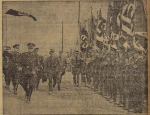
In Ostfriesland wurde die erste nationalsozialistische geschlossene Bauernsiedlung, Neu Westeel, die auf dem Meer abgerungenem Boden errichtet ist, eingeweiht.