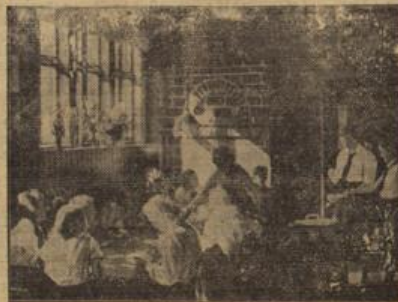
In der Jugendherberge.

Die Sonne lacht schon früh in unser nettes Turmzimmerchen und freut sich über die Langschläfer. Es ist heute unser fünfter Wandertag, da dürfen wir endlich wieder mal ausgeschlafen; da heißt es nicht schon um 6 Uhr: „Kaus aus Reht!“ Wir sind in Altensteig im nördlichen Schwarzwald in der Jugendherberge; eine Treppe führt die alte Stadtmauer hinauf, durch eine ganz kleine Küche kommt man in den Schlafraum. In früheren Zeiten wird er wohl als Bachturm gedient haben, heute stehen fünf zweistöckige Bettstellen darin, also Platz genug für uns sieben Mädels. So nach und nach rafft sich nun doch jeder auf, streckt aus seinem Schlafsaal und läuft an den Brunnen, um sich den