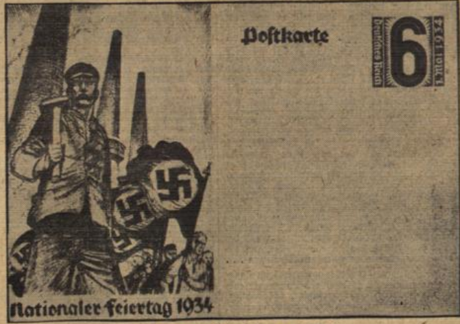
Die Festgabe der Reichspost zum 1. Mai. Eine Postkarte des Tages zur nationalen Arbeit. Durch diese Postkarte, deren Schmuck den Sinn des Feiertages der Arbeit wiedergibt, wird auch die Reichspost der Bedeutung des Tages Rechnung tragen.

Vom St. Martinus wird berichtet, daß er der Begleiter des Hl. Petrus war, in Ägypten erfolgreich