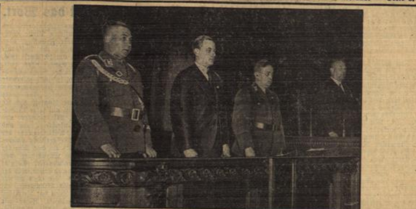
Tagung des Deutschen Sängerbundes in Berlin.