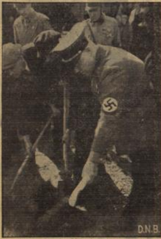
Reichshauptkammerleiter Sprenger beim ersten Spatenstich.

Am Tage des Beginns der Frühjahrsoffensive in der Arbeitsfront hat der Reichshauptkammerleiter Sprenger gemeinsam mit einer Reihe von Siedlern den ersten Spatenstich für eine Frontkämpferiedlung in Darmstadt getan.