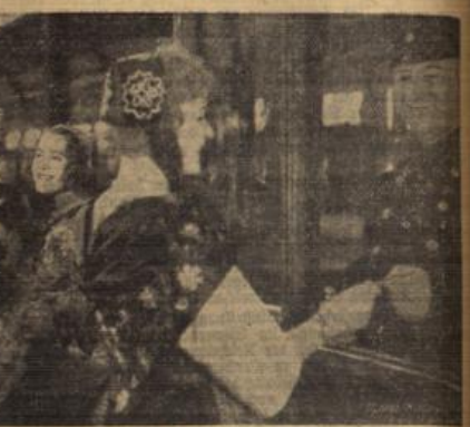
Die Wiesbadener Blumenmädels fahren zum Fest der deutschen Reise nach Berlin.

Werbung für Deutschland! Eine Werbezentrale für alle deutschen Gauen. Am 24. März wird in Berlin in feierlicher Weise die Ausrüstung und Werbezentrale „Deutsch-