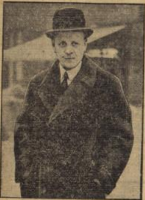
General v. Nolte