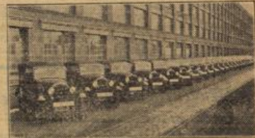
Jeder Wagen schafft Arbeit und Brot für Tausende deutscher Volksgenossen.