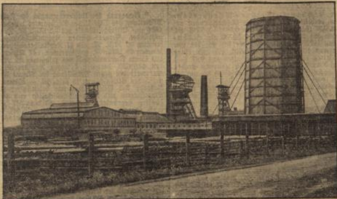
Die Karsten-Zentrum-Grube bei Beuthen.

möglichstes. Rettungspläne gehen von zwei Seiten der zu Bruch gegangenen Stöße zu. Es ist gelungen mit einem Leendenen der abgegrubenen Bergleute die Verbindung aufzunehmen. Es ist zu hoffen, daß er im Laufe des Donnerstags geborgen werden kann. Rettungsarbeiten können ihm durch eine Korbleitung zugeführt werden. Im übrigen nahmen die Bergungsarbeiten ihren planmäßigen Verlauf. Man hofft, im Laufe des Donnerstags Gewißheit auch über das Schicksal der übrigen Verfütteten zu erhalten.