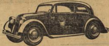
Mercedes-Benz-Herdmotorwagen, Typ „130“, 4tägige Limousine.

kraftwagen und Omnibussen in ansehnlichem Material auf, daß sie mit ihren rund 13.500 Kraftfahrzeugen den größten in einer Hand vereinigten Kraftfahrzeugpark Europas hat. Bei 2500 jahresplanmäßig betriebenen Linien werden täglich bis 4000 Fahrzeuge — vom 1/2 bis zum 50-tägigen Kraftomnibus — eine Streckenlänge von 48.000 Kilometer im Dienste der Allgemeinheit gefahren.