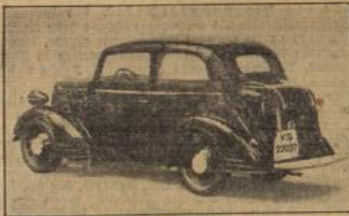
1,3 Liter Opel, 1934 mit der neuen Opel-Synchron-Federung.

Stabilität, Geschwindigkeit, unkomplizierte Bedienung, geübte Ausstattung und Sicherheit und vor allem — darauf achten die heutigen Käufer mehr denn je — billige Unterhaltung des erstandenen Objekts.