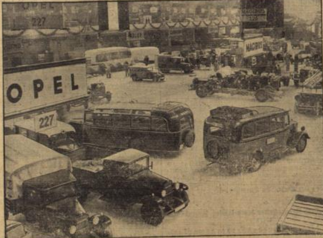
Blick in eine der gewaltigen Hallen am Berliner Kaiserdamm mit den ausgestellten Ruhwagen.

fähigkeit angeht, ist so hat man sich schwer geteilt, und die diesjährige Autoschau gibt wieder einmal den Beweis, daß Technik und Erfindergeist nie ruhen und ruhen und daß die Industrie trotz erheblicher Kosten gewillt ist, Anschaffungen und Grundrisse über Bord zu werfen, wenn es heißt, den Wettkampf zu bestehen mit der Konkurrenz, nicht nur im Inlande, sondern auch draußen auf dem Weltmarkt. Und da kann die deutsche Automobilindustrie stolz darauf sein, auf der diesjährigen Schau Neuerungen zu zeigen, die besonders dem Ausland Staunen, ernste Würdigung und Anerkennung abringen werden. Gleich auf den ersten Blick und erst recht bei eingehender Prüfung muß der