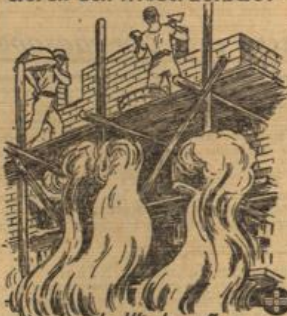
Denn der Wiederaufbau der abgebrannten Gebäude bedeutet volkswirtschaftlich eine Leerlaufarbeit!

Reichsgebiet polizeiliche Anordnungen zur sorgfältigen Auf- bewahrung von Zündhölzern und Feuerzeugen geplant. Auf Grund dieser notwendigen Polizeimaßnahmen wird es möglich sein, die von den öffentlich-rechtlichen Feuerwehreinrichtungen seit Jahren betriebenen Befragungen auf dem Gebiete des vorbeugenden Brandschutzes zu dem Erfolge zu führen, den die Sicherung unseres Volkswertes erfordert.