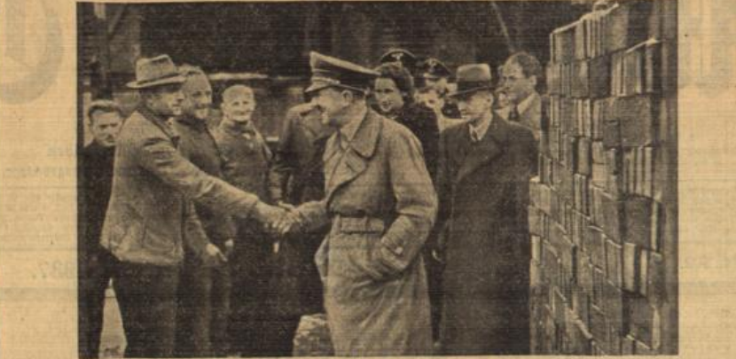
Der Führer auf dem Reichsparteitaggelände. Der Führer fand sich zwei Tage vor Weihnachten in Nürnberg ein, um einen Überblick über die Neubauten auf dem Reichsparteitaggelände zu bekommen. — Der Führer begrüßt Arbeiter, die bei den Neubauten auf dem Reichsparteitaggelände beschäftigt sind.

Paris, 27. Dez. Der Gouverneur der syrischen Provinz Djelisch war — wie gemeldet — Mitte voriger Woche auf einer Autarkie entführt worden. Nach einer Havas-Information aus Beirut ist es den infanterieausgebildeten Truppen nunmehr gelungen, die Entführer zu fassen und sie zur Auslieferung ihres Gefangenen zu veranlassen. In der