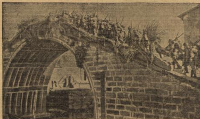
Der Krieg im Fernen Osten.

Bei dieser Gelegenheit wiesen die Japaner darauf hin, daß in dem von ihnen beherrschten Gebiet am Sonntag chinesische Freischützer, häufig sogar in Gruppen von 200 Mann und mehr, aufgelesen seien. Sie überfielen japanische Posten und Spätkrupps. Japanische Besatzung befürchte man ein Eindringen von Freischützern in Shanghai, so daß besondere Schutzmaßnahmen notwendig seien.