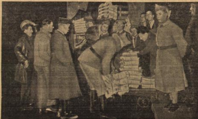
Zeitungsverteilung unter militärischer Bewachung in Paris.