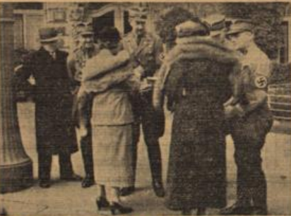
SA-Gruppenführer Prinz August Wilhelm sammelt gemeinsam mit Wiesbadener SA-Führern auf dem Kaiser-Friedrich-Platz.

An den Tagen, an denen das Winterhilfswerk im ganzen Reich seine Ertragskassensammlungen durchführt, leben Stadt und Dorf im Zeichen dieser Aktionen. Für Sammler wie Spender ist es eine Selbstverständlichkeit, Sozialismus der Tat zu üben. Denn es gibt nur noch wenige Zeitgenossen,