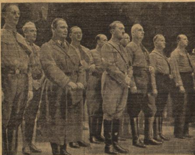
Links: Die Ehrentempel der Bewegung auf dem Königl. Platz in München. Rechts: Alljährlich wird der traditionelle Marsch des Führers mit seinen Getreuen zur Feldherrnhalle wiederholt.