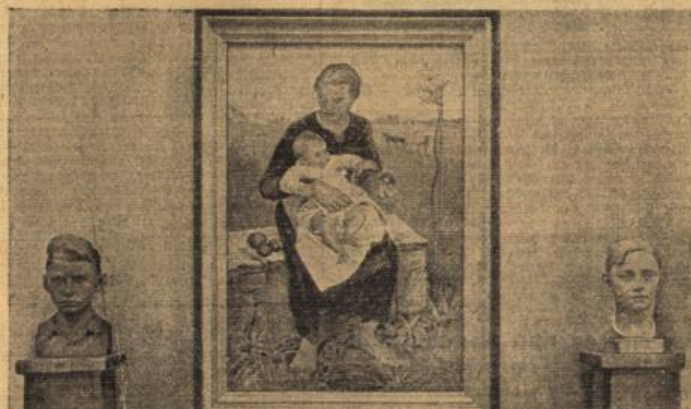
Das „Hilfswort für deutsche bildende Kunst“

Die Konferenz tritt am Dienstagvormittag wieder zusammen. In Konferenzreisen wird betont, daß man bis dahin noch keine japanische Stellungnahme erwartet. Es handele sich nur um die Regelung von Verfahrensfragen.