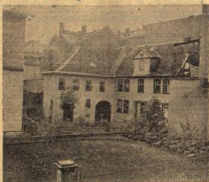
Blick auf den „Weilburger Hof“ von der Grabenstraße aus.