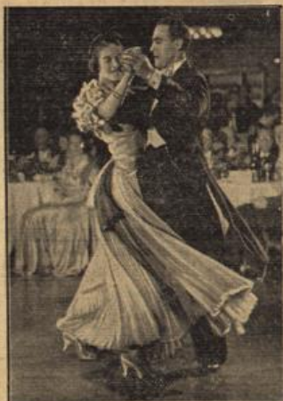
Um den „Großen Preis von Europa“.