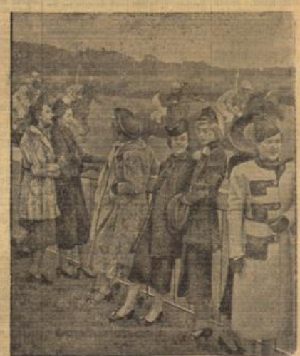
Modererntag in Hoppegarten.