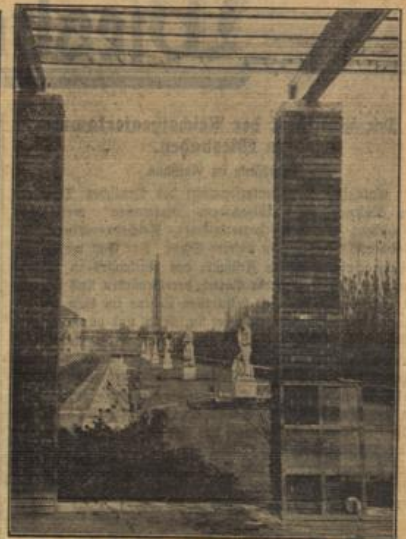
Die große Reichsausstellung „Schaffendes Volk“ in Düsseldorf. Auch eine große Gartenbau ist auf der Ausstellung „Schaffendes Volk“ in Düsseldorf zu sehen, die in vor- bildlicher Weise den hohen Stand der deutschen Garten- baukultur zeigt. (Schneiter — R.)

Kornhebung Freudenberg. Jede feste Minute muß jetzt der Siedler ausnutzen, um seine Siedlerstelle fachgemäß zu bestellen. Der bei jedem Siedlungshaus liegende Garten in Größe von etwa 1/2 Morgen erfordert nicht geringe Mühe, ihn umzugraben und das für den eigenen Haushalt be- nötigte Gemüse anzupflanzen. Weiter werden aber auch genügend Kartoffeln angebaut, um den oft nicht kleinen Siedlerhaushalt für eine längere Zeit im Winter zu ver- sorgen. Eine Anzahl Siedler hat sich noch eine Fläche Land dazu gepachtet, um auch die Futtererzeugung für das Vieh sicherzustellen. Häufig findet man in den Siedlergärten die Anlage von Brombeerbepfen, aber auch die Erdbeerpflanz- ung in neuem Maße betrieben. Viele Fräulein liefern für die Familien, die meist hinterreich sind, einen großen Teil guten, heimischen Strauchfrüchtl. Besonders hervor- zuheben ist die ersteilische Junabme der Obstbaum- pflanzung, deren man sich neuerdings unter fachmännischer Beratung zugewandt hat. In wenigen Jahren werden die Siedler von den sorgfältig ausgewählten Qualitätsobst- sorten gute Erträge erzielen. Das Nachpflanzen der Obst- bäume ist fast überall durchgeführt. Erwähnung verdienen auch die schönen Blumenanlagen, die man in den Vor- gärten der Siedlerstellen antrifft. In der frischen, reinen