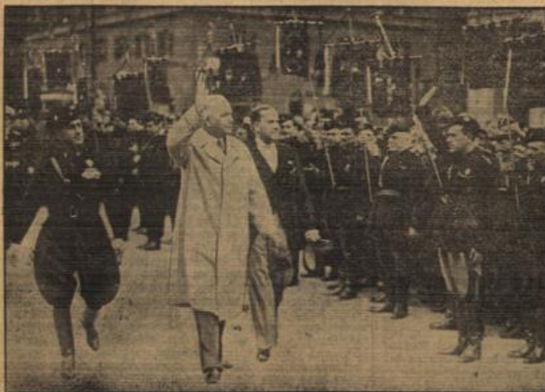
Freiherr von Neurath (Mitte), begleitet vom italienischen Außenminister Grafen Ciano und Parteileiter Starace, die Front der angetretenen Ehrenformationen ab.