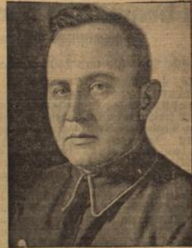
Reichsbauernführer A. Walther Darré.

Kein Führer, uns Bauern eint nicht so sehr die gleiche Art der Berufsarbeit, uns eint nicht so sehr die Jugendzeitigkeit zur selben Organisation, uns eint nicht, und Sie finden es, ob Sie hinstimmen in die einfache Stube des Bergbauern in den höchsten Bergen, ob Sie hinstimmen in das einfache Haus des Moorbauern in dem tiefsten Moort, ob Sie nach Osten oder