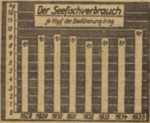
Graphisch-Statistischer Dienst (M.).

In den Jahren 1924 bis etwa 1934 war der Verbrauch an Seefischen bemerkenswert gleichbleibend. Erst in den letzten beiden Jahren ist es, wie das Institut für Konjunkturforschung in einem Bericht feststellt, gelungen, mit Hilfe einer umfänglichen Werbung, durch Einführung von Fischzoo, Verteilung von Fischen durch das Winterhilfswerk usw. gelungen, den Verbrauch an Seefischen nennenswert zu erhöhen. Der Seefischverbrauch je Kopf der Bevölkerung, dessen Entwicklung in dem nachstehenden Schaubild für die letzten acht Jahre dargestellt ist, betrug 1934 8,8 kg betragen. Dieser Verbrauch konnte 1935 auf 10,0 kg gesteigert werden, wovon 5,7 kg auf Deringe (einschließlich Salzheringe) und 4,3 kg auf Schellfisch, Kabeljau entfielen. 1936 dürfte eine weitere Verbrauchsteigerung gebracht haben. Der Verbrauch ist nunmehr größer als in der Vorkriegszeit (1913 7,4 kg je Kopf der Bevölkerung).