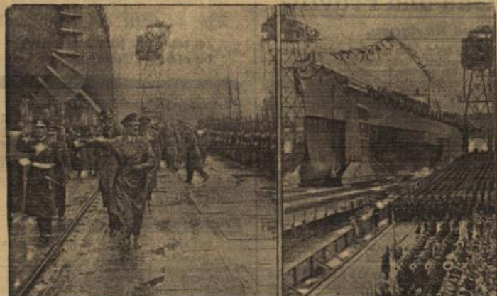
Vom Stapelauflauf des Schlachtschiffes „Scharnhorst“.

Die Wasserverdrängung des neuen Schlachtschiffes „Scharnhorst“ ist 26000 Tonnen, die Länge in der Wasserlinie beträgt 226 Meter, die größte Breite 30 Meter. Das Schiff hat einen mittleren Tiefgang von 7,5 Meter. Das größte Kaliber ist 28 Zentimeter.