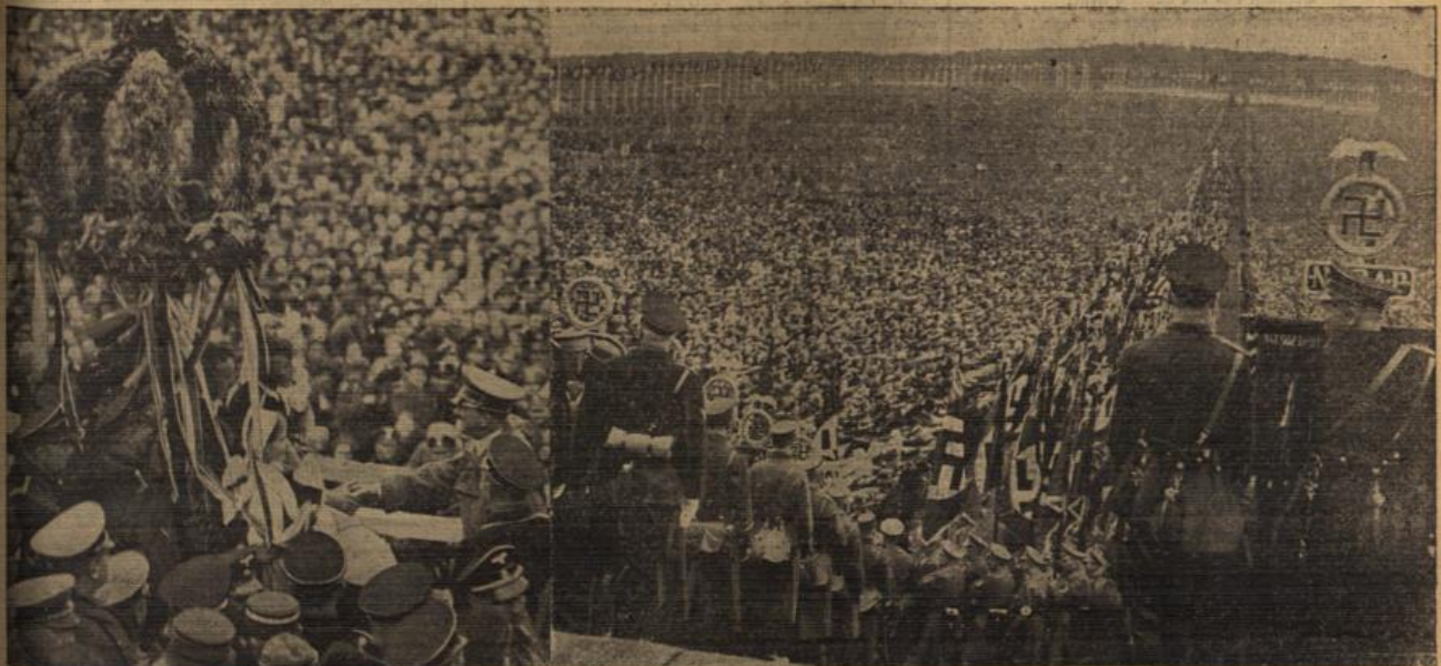
Links: Der Führer ist auf dem Bildeberg eingetroffen und begrüßt unter dem Erntekranz Bauernabordnungen. — Rechts: Scharbild von der Feier des Erntedankfestes auf dem Bildeberg (Scharbild von der Feier des Erntedankfestes auf dem Bildeberg, M.)

Es gibt heute auch bei uns vielleicht Leute, die das nicht verstehen können oder nicht verstehen wollen. Wenn aber jemand sagt: Ich beurteile meine Tätigkeit nach meinem eigenen Interesse, oder: ich ermehle den Augen meiner Arbeit nach meinem eigenen Worte, so muß ich ihm antworten: Mein lieber Freund, du bist ein ganz gemeiner egoist! Wenn andere Volksgenossen das genau so machen, wo kommen wir dann in Deutschland hin? Du hast nicht mehr Recht als der andere Volksgenosse neben dir! Ich halte es nicht für ein Glück — weder für den