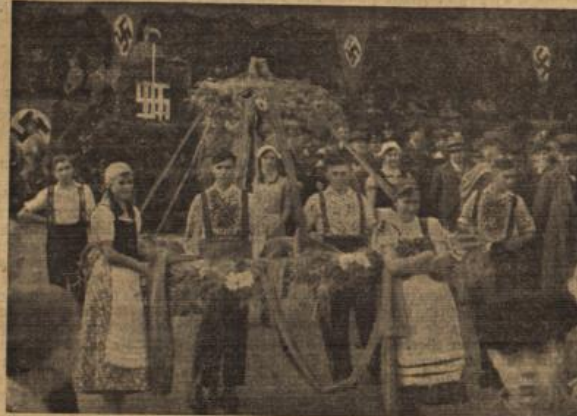
Links: Die Jungbauernabordnung mit dem Erntedank der Stadt Wiesbaden. — Rechts: Deutsche Jugend tanzt unterm Erntedank. (2 Photo: Mäckenheimer, S.)

Rundgebung auf dem „Reinfeldchen“ , zu der sich die Vertreter der Behörden und zahlreich Volksgenossen eingefunden hatten. Nach dem Einmarsch der Standarten und Fahnen zogen Jungvolk-Junioren im Beginn der Rundgebung an. Sprecher der HJ, Reden von Saat und Ernte, während die Jungbauernabordnung den bunten Erntedank der Stadt Wiesbaden